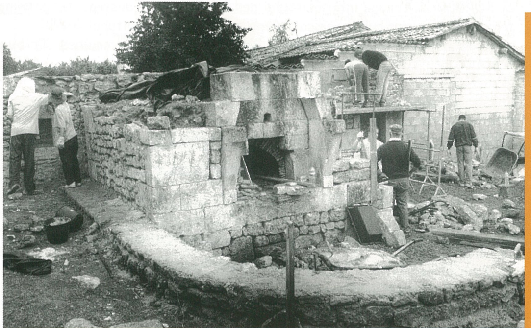
Au petit Guillon, des jeunes du monde entier ont refait un four...et c'est une réussite !