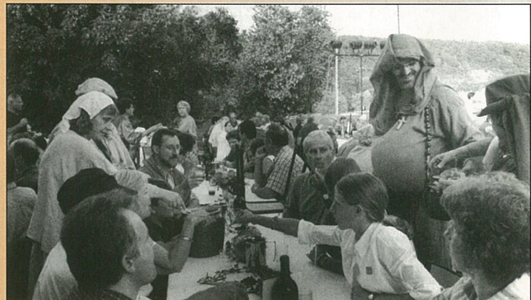
Il n'y a pas d'âge pour bien manger ; succès pour le repas du moyen-âge.