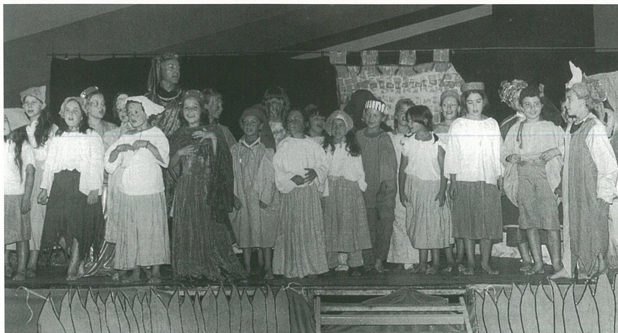
Un très beau spectacle estival, celui du centre de loisirs. !