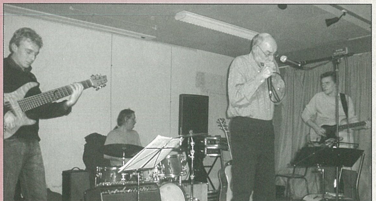
Ils ont eu le blues lors de l'A.G. de la MJC.