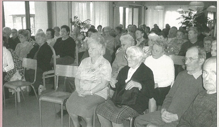
Assemblée studieuse du club des Aînés