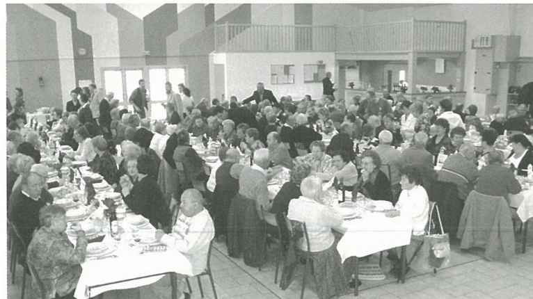
Grosse affluence et bon appétit au repas des aînés.

rité. Ainsi vous ferez : - un acte humanitaire dans le domaine de la santé en permettant au Comité de la Ligue Contre le Cancer de récolter des fonds pour poursuivre et intensifier ses actions - un acte écologique en préservant l'environnement puisque les consommables informatiques sont considérés comme polluants Votre participation à cette collecte peut se situer dans votre milieu professionnel, mais vous pouvez également intervenir dans votre entourage en récupérant autour de vous des cartouches usagées et les déposer au siège du Comité ou faire appel au 05.45.92.20.75 Merci pour votre participation.