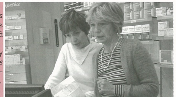
Changement de pharmacienne Place de la gare

De nouvelles activités se créent à Mouthiers! Nous y reviendrons dans un prochain numéro.