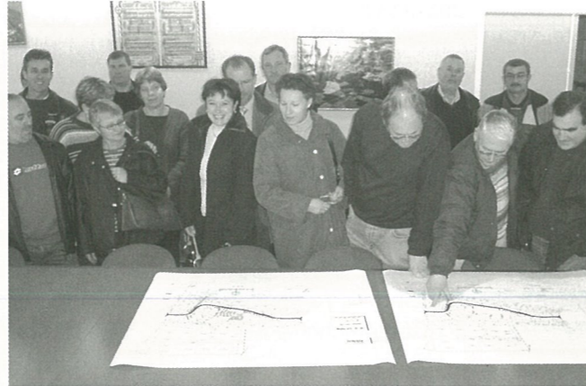
Aménagement des Justices, les habitants participent