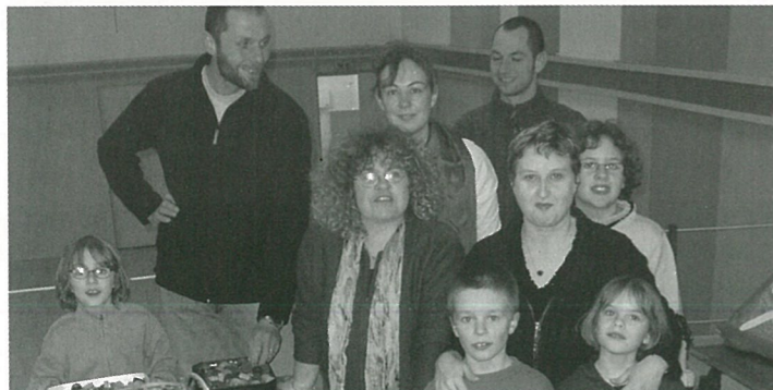
Ambiance bon enfant...pour la soirée des parents...d'élèves

Le soir, soupe à l'oignon gratuite Inscriptions M. GERMON 05.45.67.98.57 M. BOISSARD 05.45.67.82.63 M. BENNACEUR 05.45.67.84.46