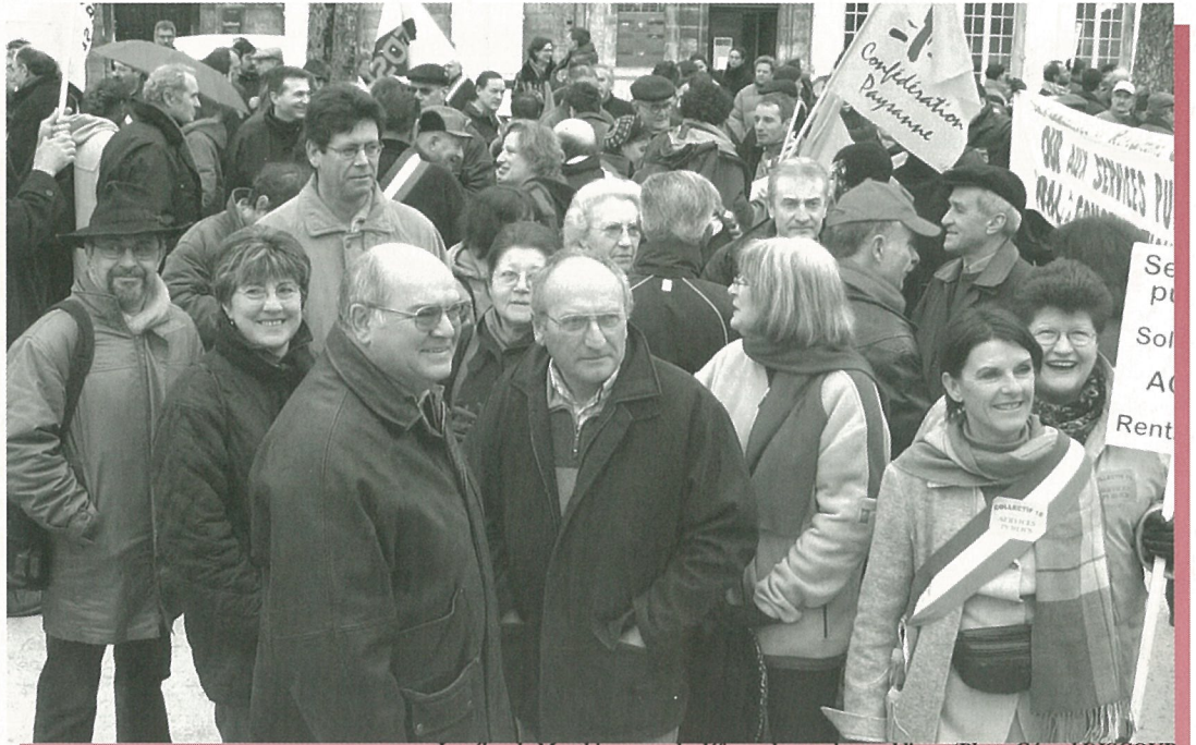
Les élus de Mouthiers pour la défense des services publics