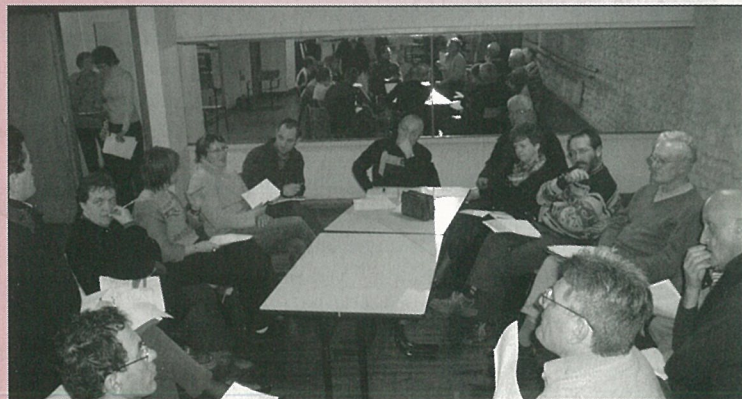
C'est parti pour le patrimoine, thème de la fête intercommunale en juin.