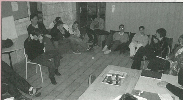
Rencontres entre Ides élus municipaux et des jeunes