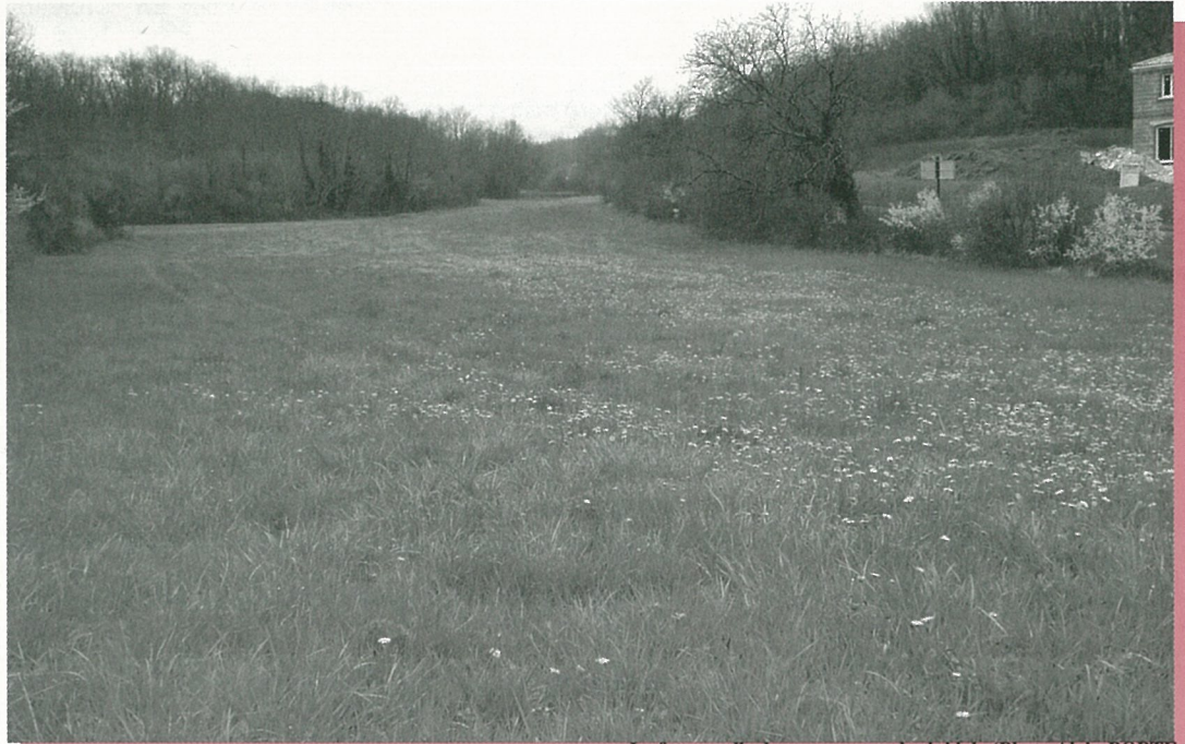
La future salle de sports, au stade...initial.