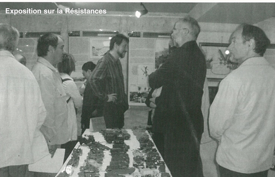
Exposition sur la Résistances

Le Conseil Municipal organise les tours de