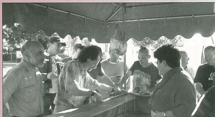
Rencontres entre Ides élus municipaux et des jeunes