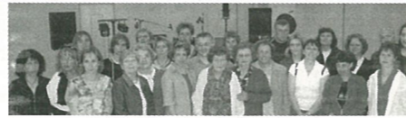
Anciens élèves des années 60 des classes de Mesdames HOUGARD, PIGNOUX, PRIGEAUD, DEDIEU et RIVET