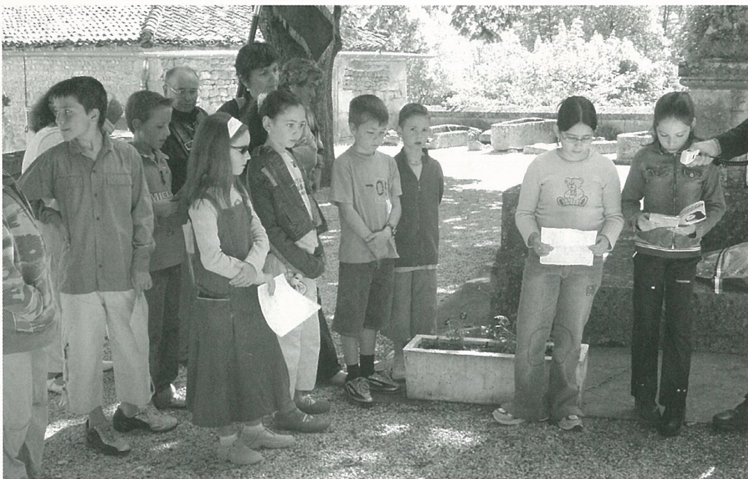
La voix des enfants pour les paroles de déportés lors de la commémoration du 60 ème anniversaire de la libération des camps