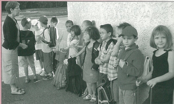
Alignement élémentaire... pour les plus grands