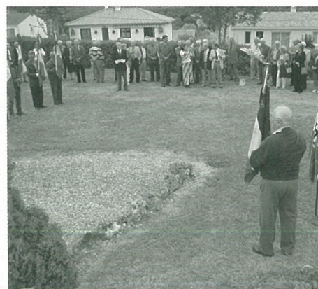
Cérémonie souvenir d'août 1944

Le Conseil Municipal demande que soit fait rapidement dans le département un bilan de la déréglementation du secteur de l'énergie. (voir ci contre).