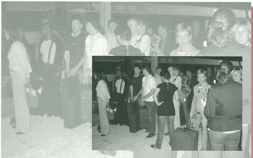
Rase campagne pour le TGV, raser la gare pour la SNCF, est-ce vraiment la bonne voie ?