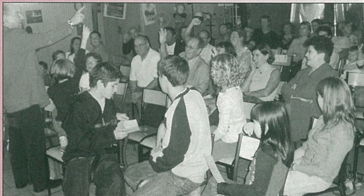
Lots à la bouche pour la soirée de l'Age de Faire