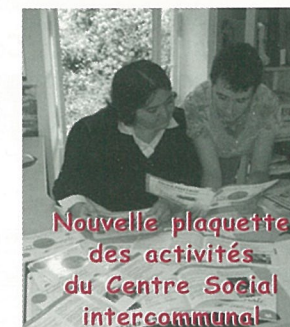
Nouvelle plaquette des activités du Centre Social intercommunal

Renseignements au Centre Social : 05.45.67.84.38