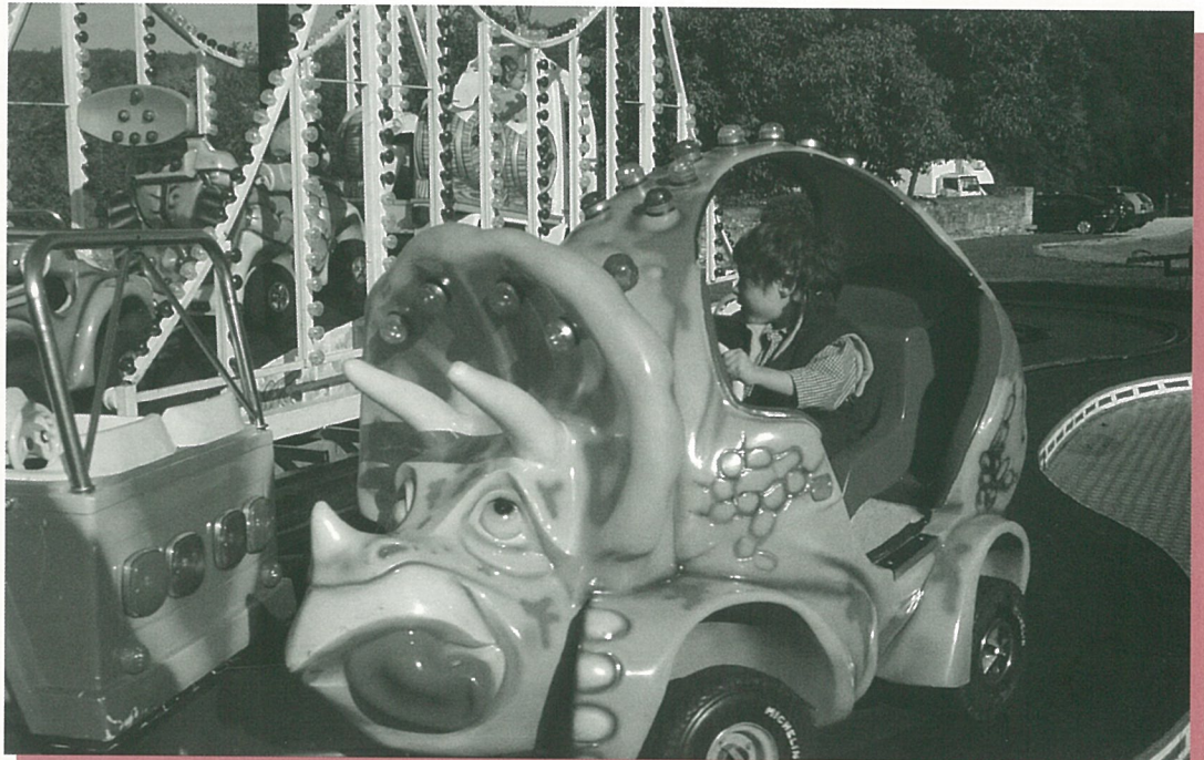
Les dinosaures, toujours d'actualité