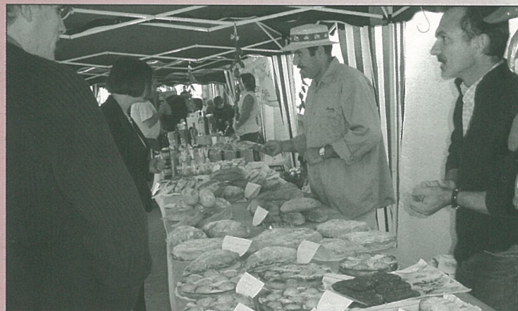
Pour les automnales, le succès va croissant...