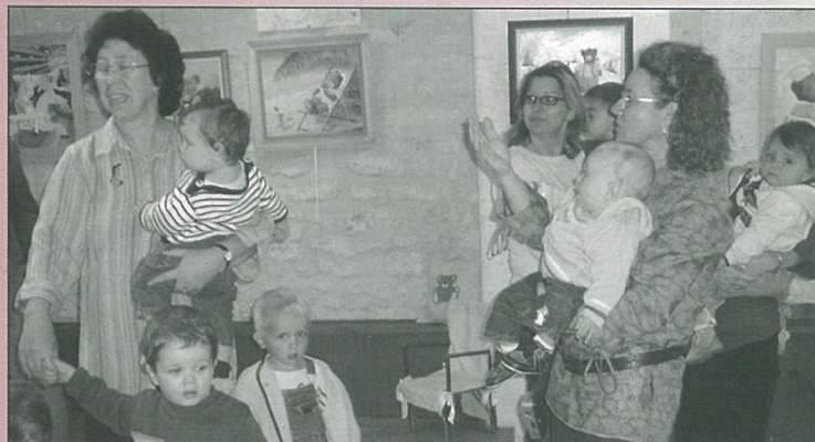
Les petits sont chez eux en Nourserie...