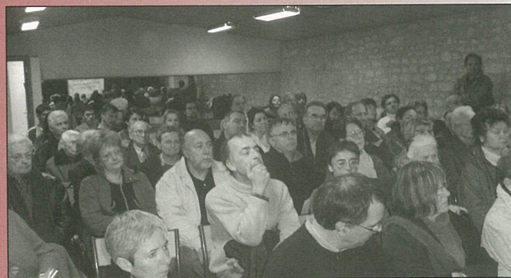
Les cavernes ont fait salle comble...lors de la conférence sur la préhistoire.