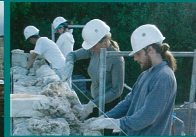
Le chantier international du four du petit Guillon à l'image du monde et de l'année 2005 : de toutes les couleurs !