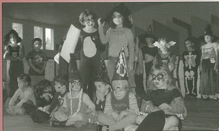
9a marche à la baguette...de sorcière !