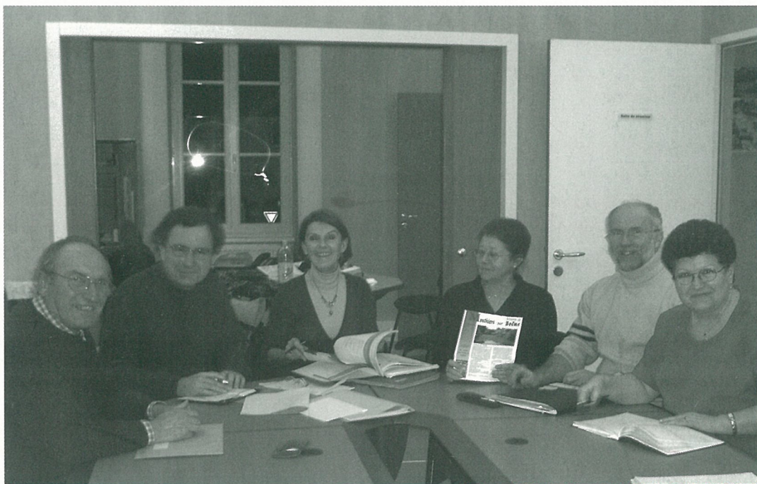
Madame le Maire et ses adjoints