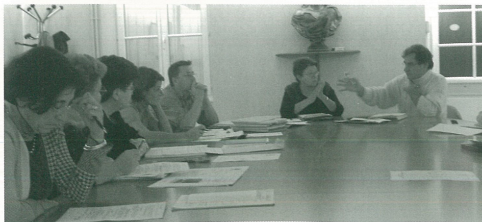
Réunion du Conseil Communal d'Action Sociale - (Photo Alain PORTE)

Prochaine réunion publique du Conseil Municipal VENDREDI 3 FÉVRIER à 20 H 30