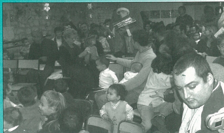
Le Père Noël avait mis le paquet à la crèche