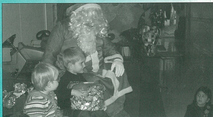
Le Père Noël avait de la classe... à la maternelle !