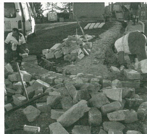
Sur les bords de l'aire de jeux

Le conseil unanime remercie Raymonde VALLAT de son action dans la collectivité.