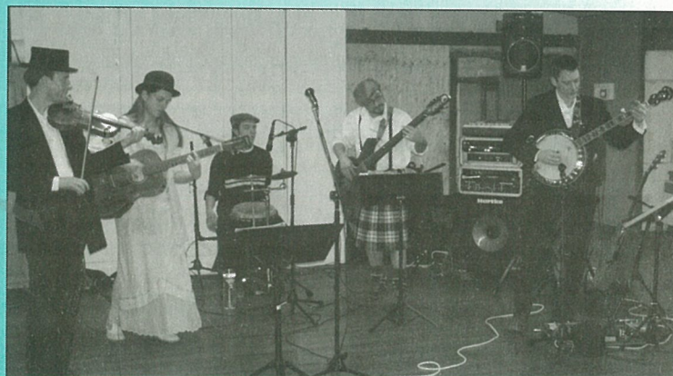
Jeux des style du groupe Bastringue lors de l'AG de la MJC