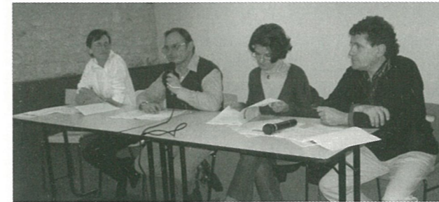
Le président de la M.J.C. lors de l'A.G. présente un bilan riche et des bons comptes