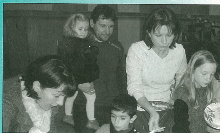
Jeux et crêpes avec les parents d'élèves