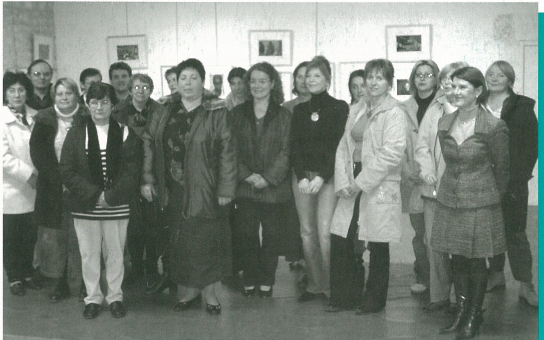
les assistantes maternelles quittent le giron de la M.J.C.