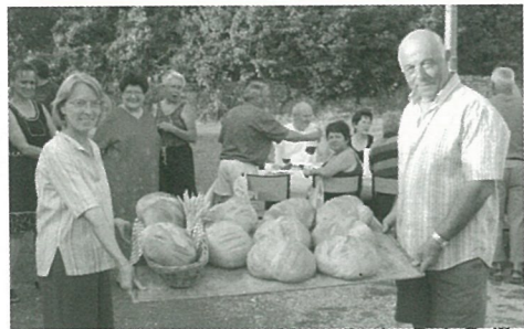
On a cassé la croute ensemble au Rosier-Petit Guillon...