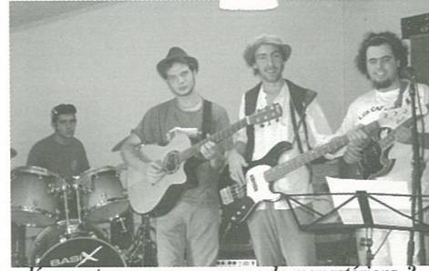
découvert un nouveau groupe de monastériens...?