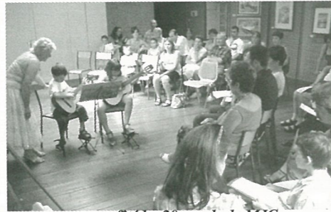
fête les 20 ans de la MJC...