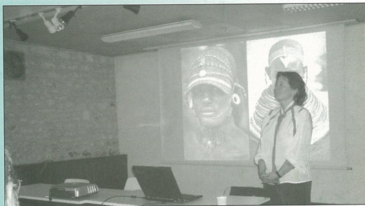
Présentation du chantier de fouille, la préhistoire à découvrir.