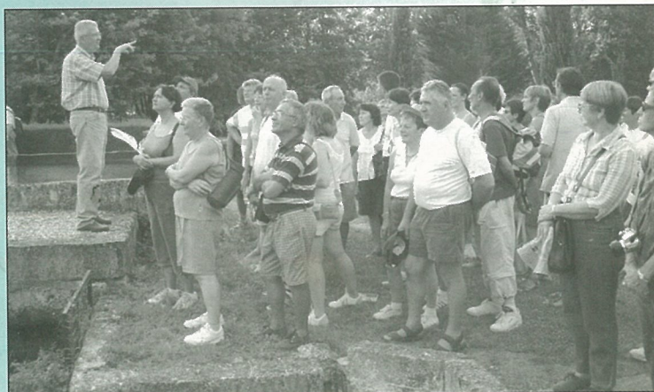
Visite des jardins de Forge