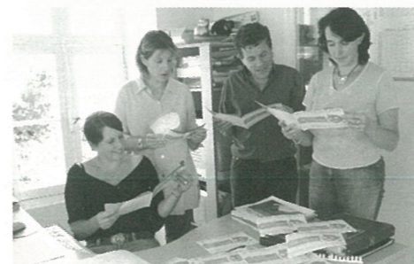
La plaquette des activités à la page rentrée...