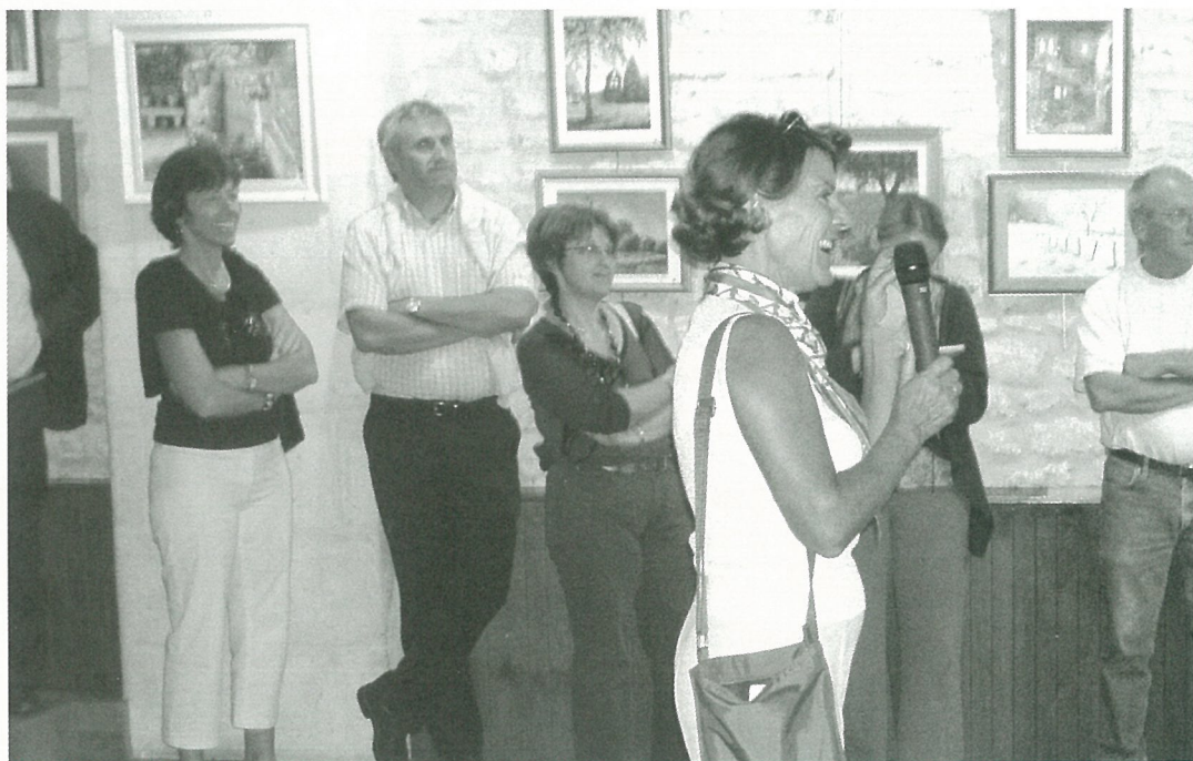
Bienvenue à celles et ceux qui ont choisi MOUTHIER sur BOËME comme nouveau cadre.