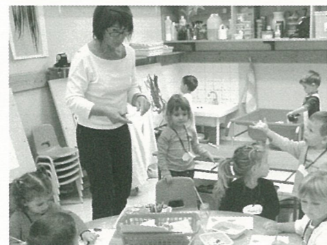
Atelier peinture à la maternelle, on en voit de toutes les couleurs

Le prix de location au km restera inchangé (0,50 €/km) ; la location se fera avec plein de carburant effectué, à charge pour l'association locale utilisatrice de remettre le véhicule avec plein de carburant effectué.