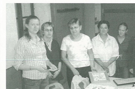
les brodeuses de la MJC...

Fabienne FAUVIN exposera à la MJC à partir de fin octobre