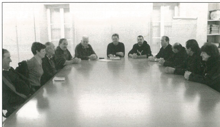
A.G. Tourbières Loisirs, beaucoup de présents, peu d'empêchés...