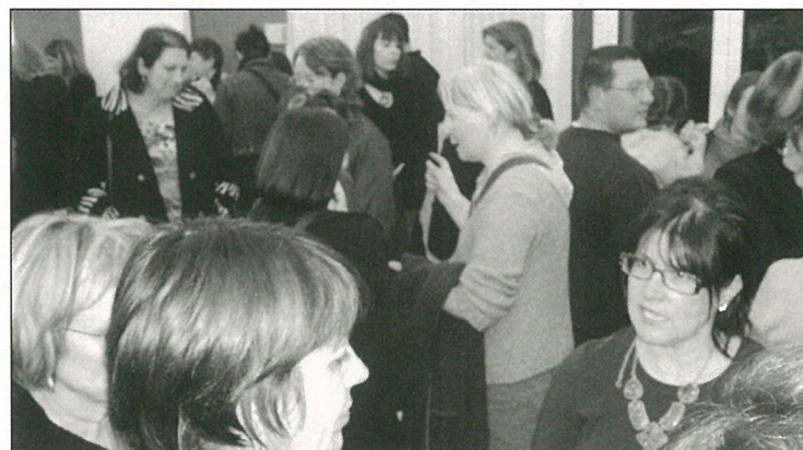
La fêve du mercredi soir pour les vœux au personnel communal