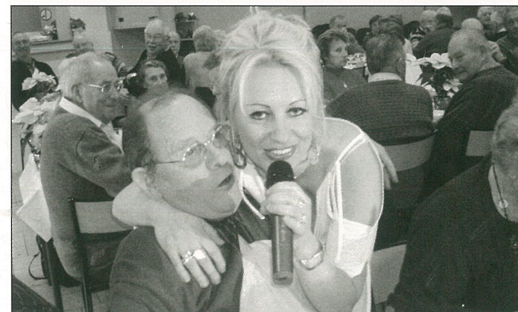
la fêve du dimanche soir pour le repas municipal des seniors !