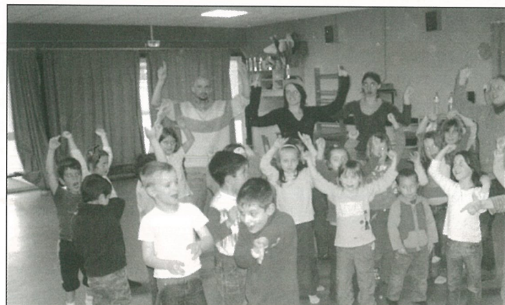
La fête au centre de loisirs