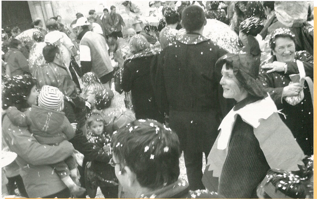
Mars, retour des giboulées...de confettis