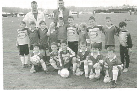
droit au but..!