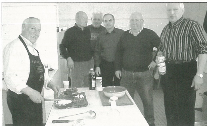
Repas de la FNACA