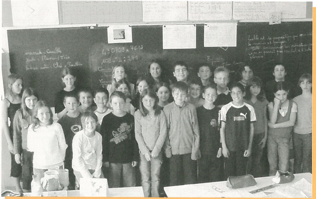
Les élèves de l'école élémentaire ont de la classe...

Bulletin d'Information Locale édité sous la responsabilité du Conseil Municipal de Mouthiers sur Boëme