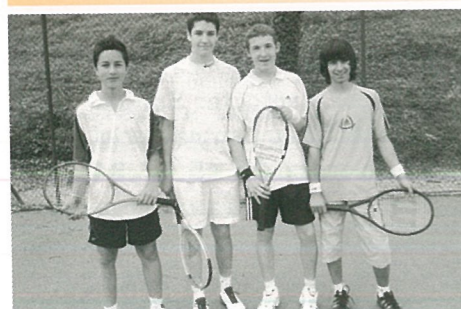
Ils iront à Roland GARROS...