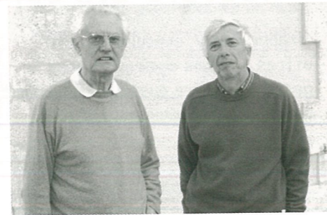
randonner sur tous les chemins...