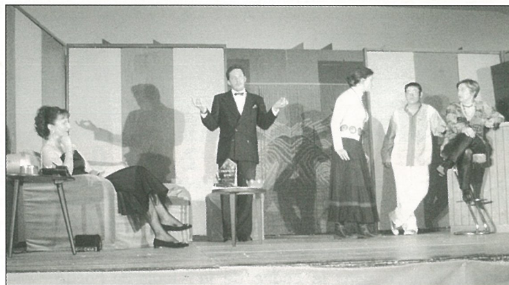
Théâtre du coeur vert !