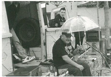
La frairie malgré la pluie...