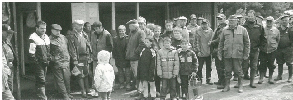
...Les pêcheurs ont tous les âges.