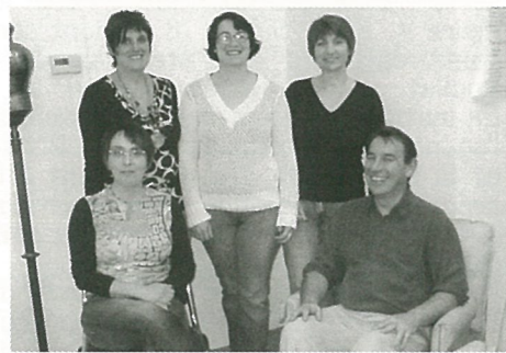
L'Age de Faire a la pêche...