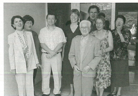
Tous les responsables du Foyer Logement depuis son ouverture