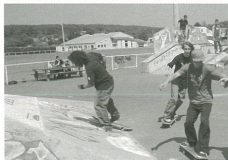
ballets aériens du skate : c'est le rythme qui compte !