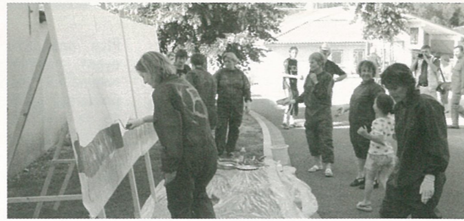
l'atelier peinture de la MJC sorti de son cadre