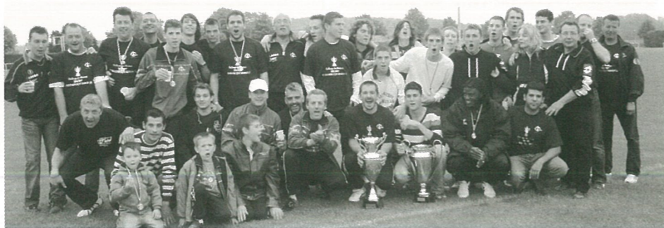
L'équipe C, C du sérieux : vainqueur de la coupe

VENDREDI 6 juillet 20 H 45 à l'église de Mouthiers VOIX BASQUES David Olaïzola et compagnons