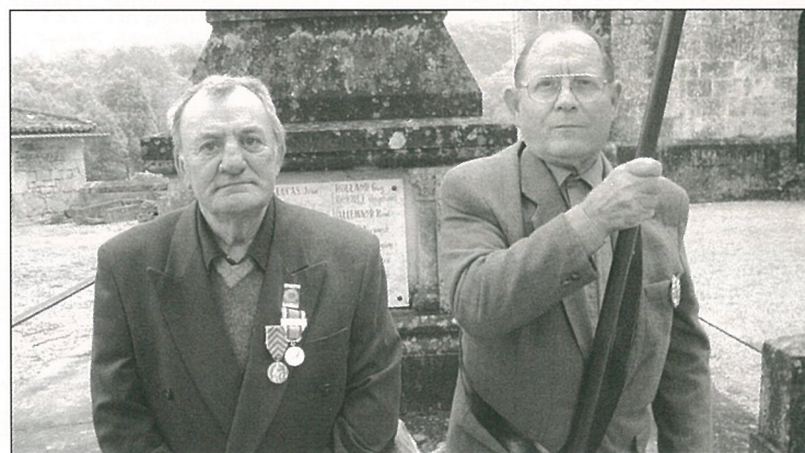
Deux anciens combattants décorés.