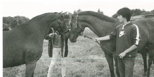
Tête à tête lors journée de l'attelage