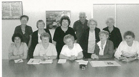
L'équipe du secours populaire en assemblée