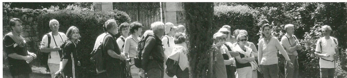
Jardins de Forge ouverts pour le monde...