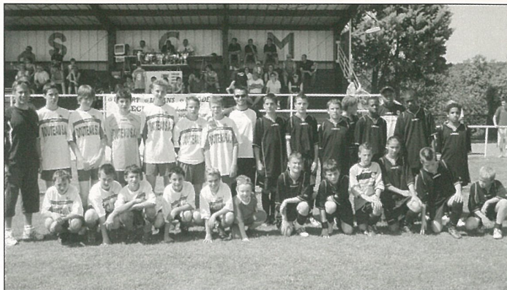
13 ans thousiasmant le tournoi du SCM