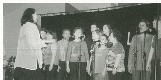
Voix en scène et chansons en tête...