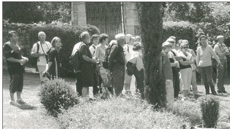
Très oxygénante la journée des jardins à Forge