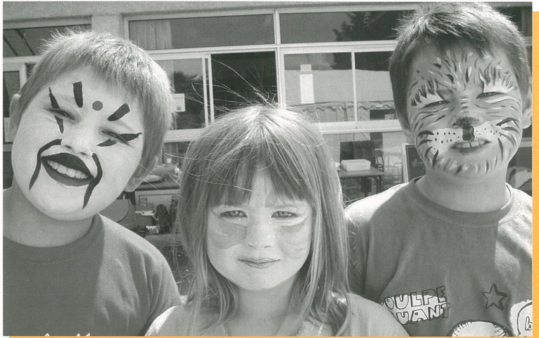
L'été saison des enfants