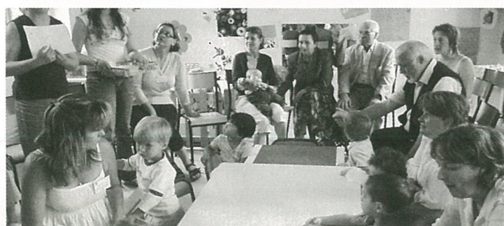
Têtes blondes et têtes grises dans les locaux de la crèche...