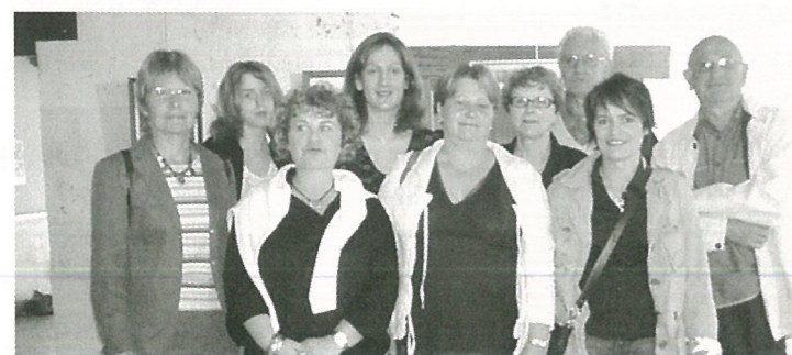
Pas encore la Tate gallery mais presque pour l'atelier peinture de la MJC