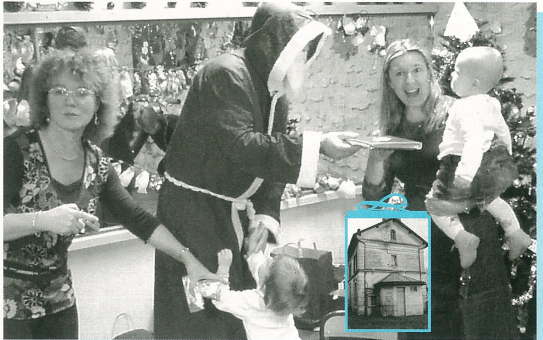
L'effet Père Noël... des trains électriques pour certains, une gare pour tous...!

Bulletin d'Information Locale édité sous la responsabilité du Conseil Municipal de Mouthiers sur Boëme