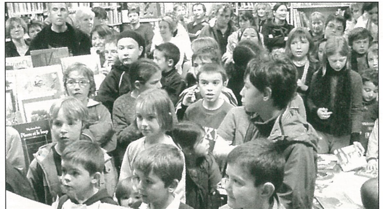
Les livres et leurs lecteurs rayonnent à la bibliothèque...