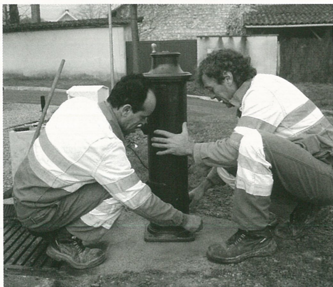
Une nouvelle borne fontaine posée par les agents techniques municipaux

Dans le cadre des travaux de renforcement de la RD 35 sur les communes de La Couronne et Mouthiers, le département se propose d'acquérir 38 m 2 appartenant à la commune de Mouthiers sur le territoire de la commune de La Couronne. Le Conseil accepte cette proposition pour l'euro symbolique, et laisse à la charge du département les frais de bornage et notariés.