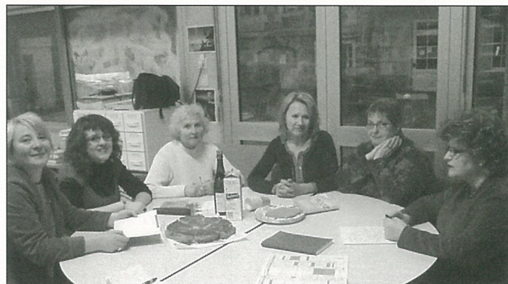
Actions de début d'année, l'équipe de la bibliothèque s'y livre...