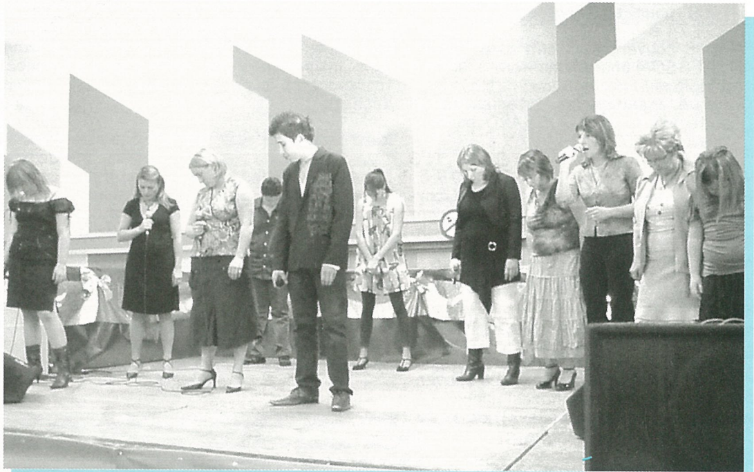
Voix en scène : le talent, c'est tout chant ...