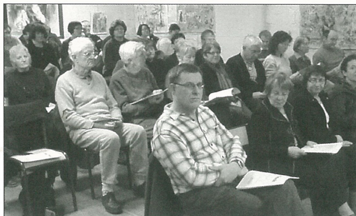
La Maison des Jeunes et de la Culture étagée...