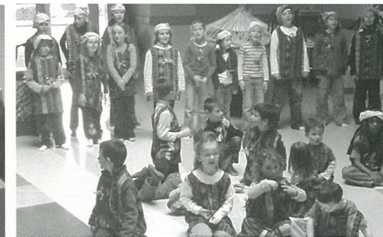
Les enfants du centre de loisirs ont fait le spectacle