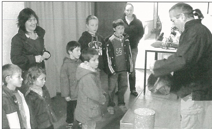
L'art et la matière à discuter avec le sculpteur