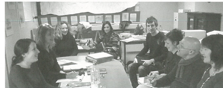
L'équipe du Centre social prépare la journée intergénération