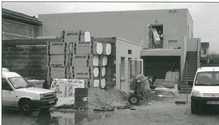
L'Établissement pour Personnes Agées : quel chantier !

Mme Anne-Marie MARTIGNAC - 05 45 67 84 88