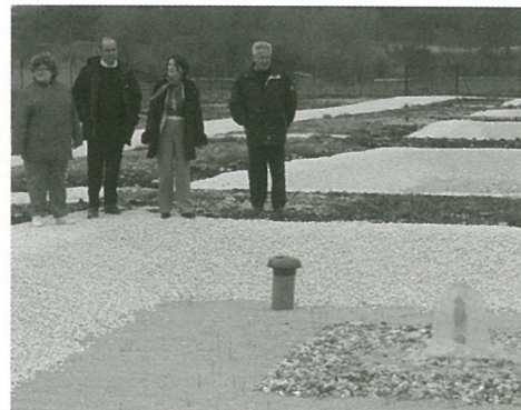
La nouvelle station dépuratoire est en marche