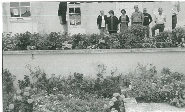
Le fleurissement de Mouthiers visité par la commission départementale