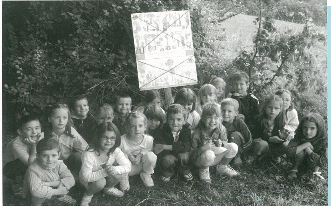
Petit bois restera propres si les promeneurs respectent l'action des enfants

Bulletin d'Information Locale édité sous la responsabilité du Conseil Municipal de Mouthiers sur Boëme