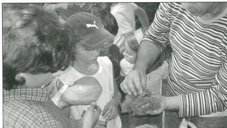
Vraiment de quoi en faire une préhistoire cet été..!