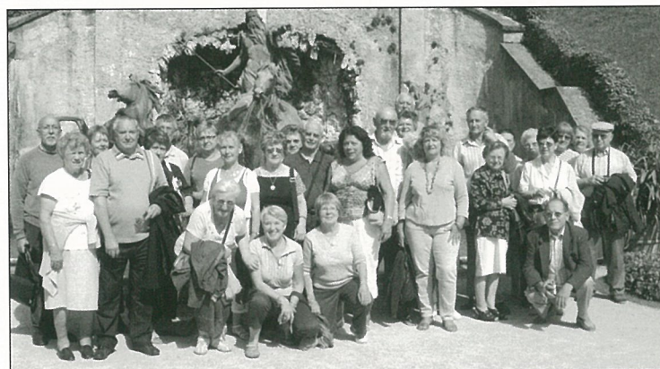
Le Cercle des Aînés au Tyrol, le pays des tabliers de cuir