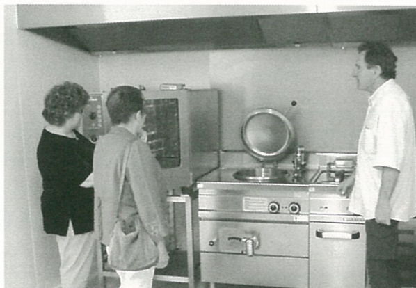
Nouvelle cuisine au Foyer

Le Conseil Municipal décide d'instaurer un abattement de 10% sur la valeur locative des habitations soumises à la taxe d'habitation, en faveur des personnes handicapées ou invalides, qui prendra effet en 2009.