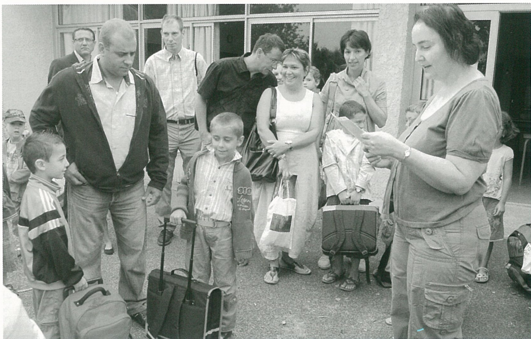
La rentrée c'est classe..!