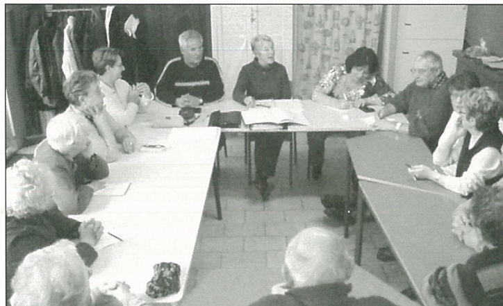
La quadrature du cercle... des aînés !