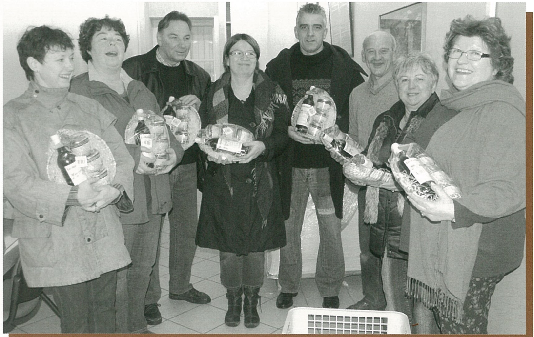
Panier garni pour les octogénaires.