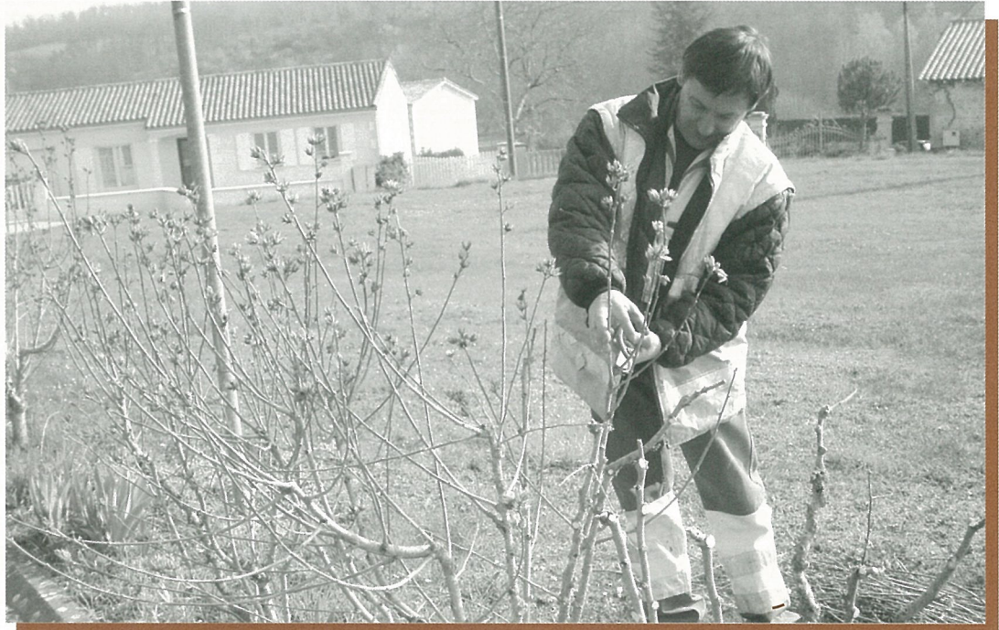
Haie, haie, c'est le printemps...!

Bulletin d'Information Locale édité sous la responsabilité du Conseil Municipal de Mouthiers sur Boëme