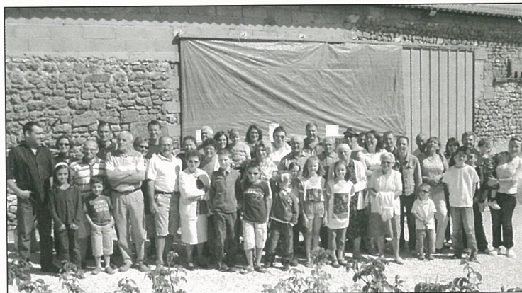
Voisinade à l'ouest (Gersac)...