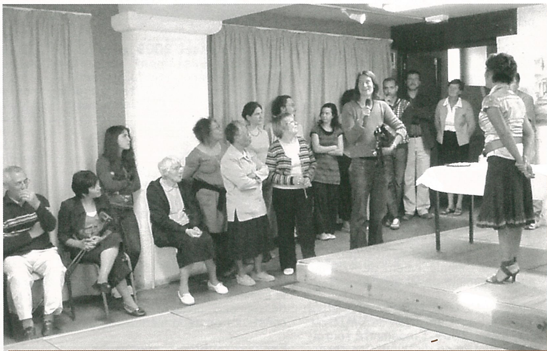
Les nouveaux habitants de 2009 accueillis par les élus municipaux et les responsables des associations