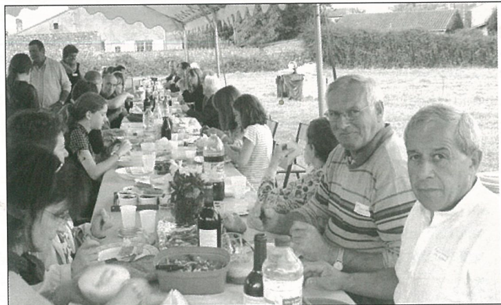
... et au sud de la commune