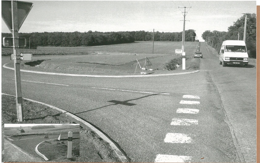
Des routes en sécurité... ou l'insécurité en déroute.

Bulletin d'Information Locale édité sous la responsabilité du Conseil Municipal de Mouthiers sur Boëme