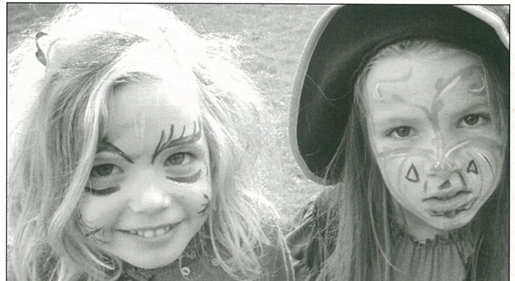
Même pas peur d'être une apprentie sorcière