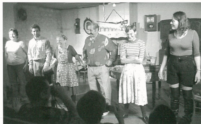
Le public a apprécié le spectacle en parlé charentais de la gherbaude