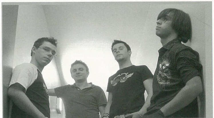
Backlife en concert au Logis de Bournet