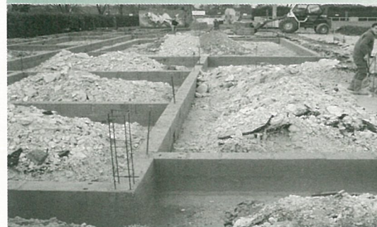
Fondations du futur Club House, aménagement de la cuisine de la salle Gilles Ploquin et championat de GRS