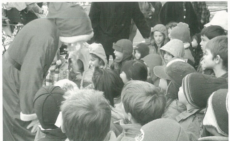
Toujours la même popularité..!