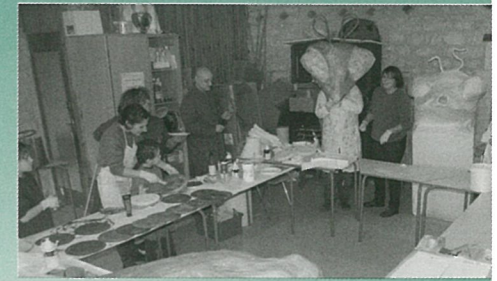
Le carnaval se prépare