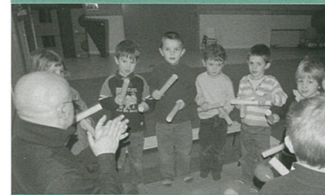
L'éveil musical sans fausse note

Pour les personnes intéressées, des ateliers de préparation seront ouverts tous les samedis de 14 h à 17 h à la MJC (05.45.67.84.38)