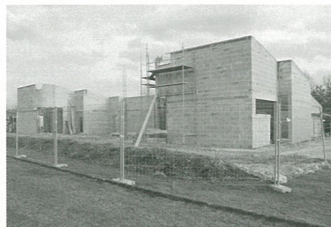
Le club house prend forme

Elections régionales Le conseil municipal établit la tenue des bureaux de vote pour les élections régionales des 14 et 21 mars 2010.