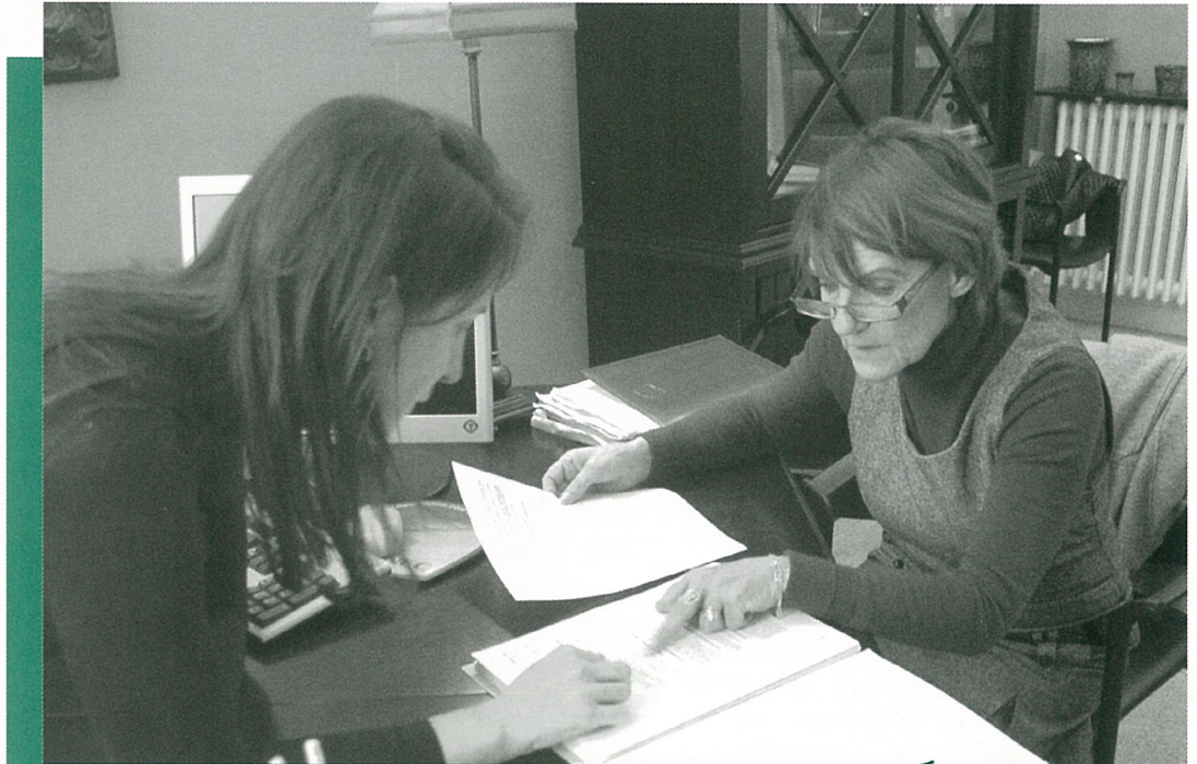
Devant Maître ARLLOT notaire, Madame le Maire appose sa signature confirmant l'achat de la gare