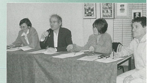
Ambiance studieuse... puis brésilienne lors de l'A.G. de la M.J.C.