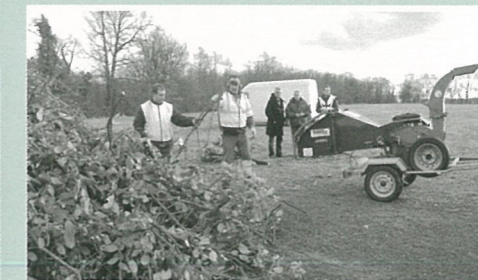
Les services techniques sur tous les fronts essai d'un broyeur à déchets verts et travaux de raccordement de réseaux