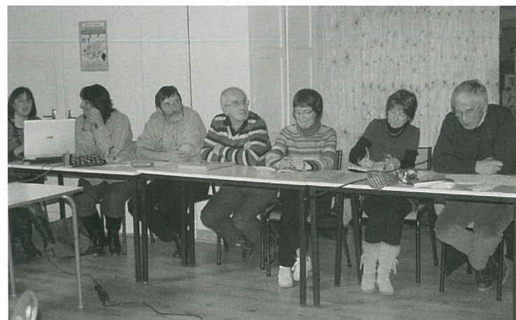
Randonnées balisées : même pas de cartes...!