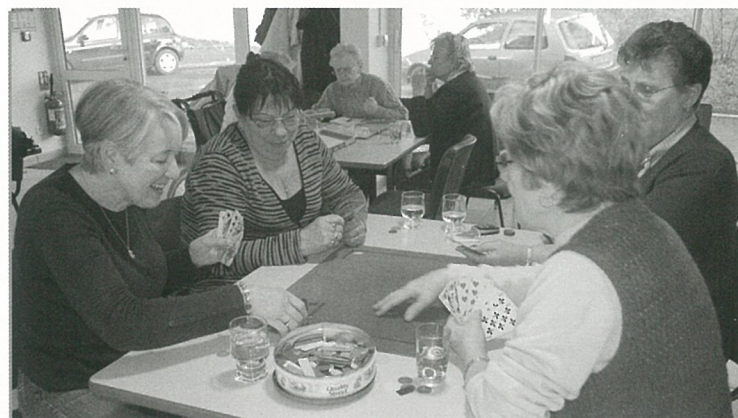
Club des aînés : on ressort les cartes...