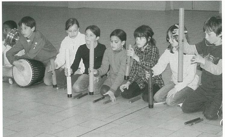
L'éveil musical, ça n'est pas du pipeau...!