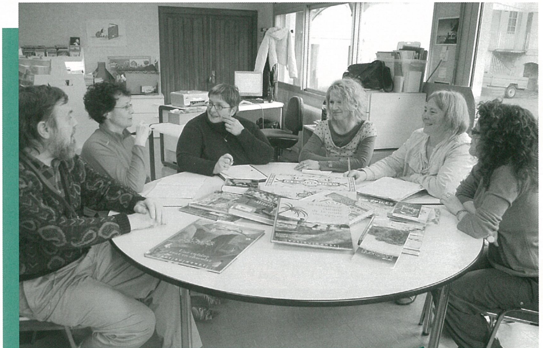
Un voyage épicé se prépare à la bibliothèque.