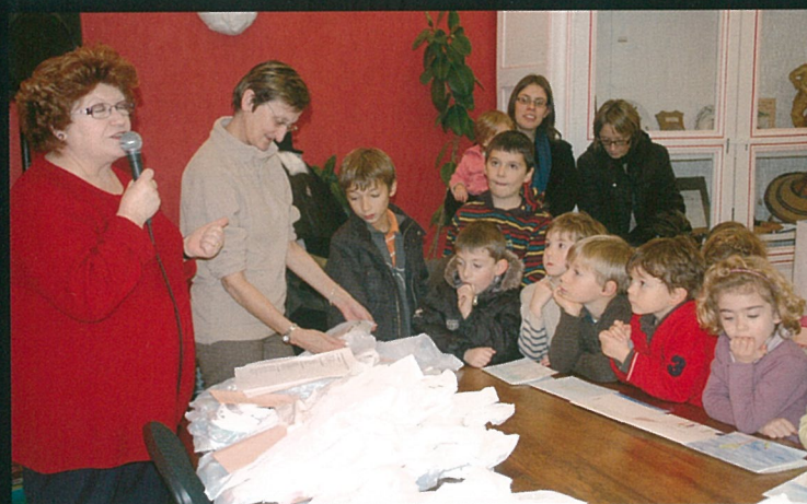
Le plaisir de lire en tête...