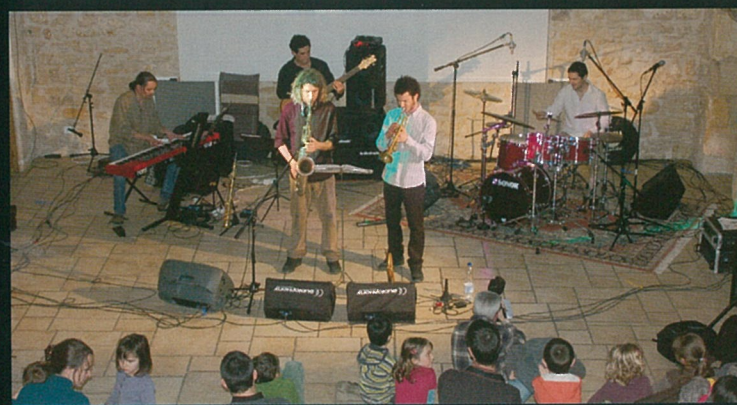
Les concerts au logis de la grange à Bounet, ça les botte sans faire de foin...!