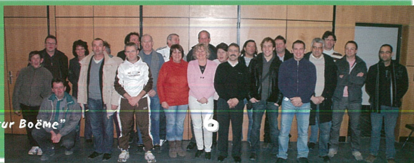
"Vivre à Mouthiers sur Boême"

Merci d'avance et dès à présent, retenez votre week-end pour venir souffler avec nous ces 70 bougies.