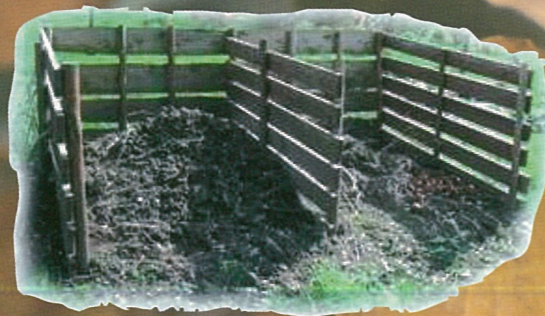
Compost en tas