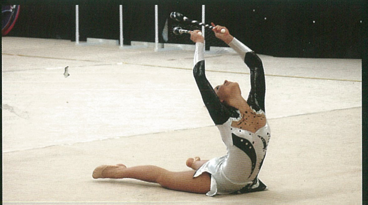
Gymnastique Rythmique, Sportive... et poétique !