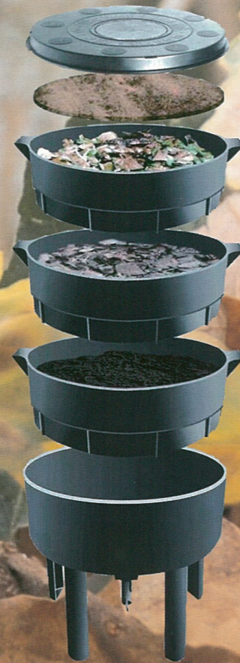
Exemple d'un lombricomposteur