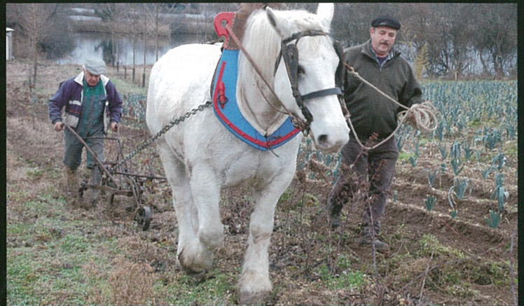
L'amour du labour