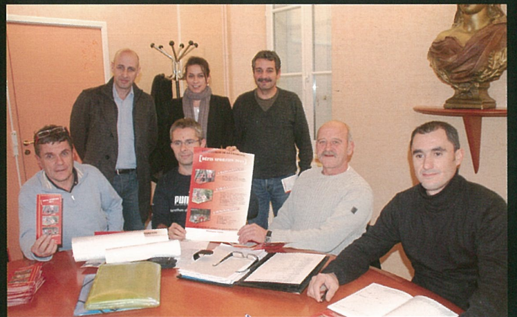
Le 2ème trail de la Boème se prépare