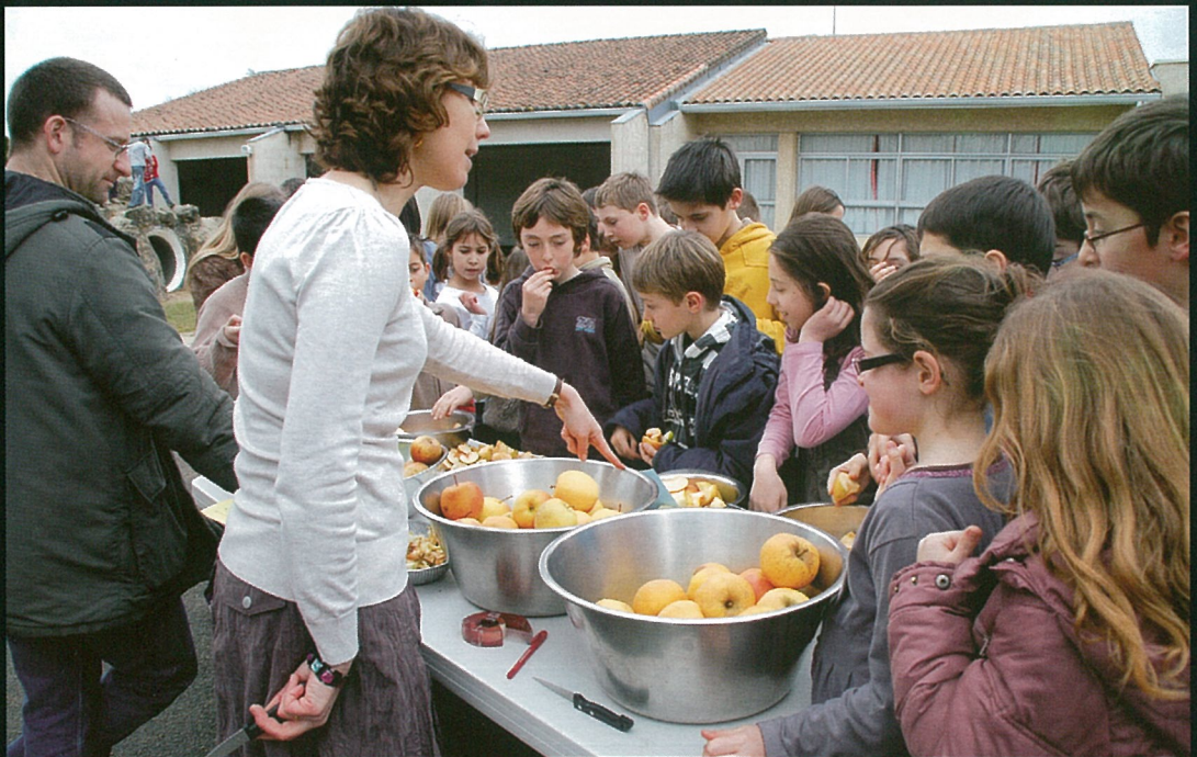
Pommes pommes pommes... les écoliers connaissent désormais la musique sucrée !