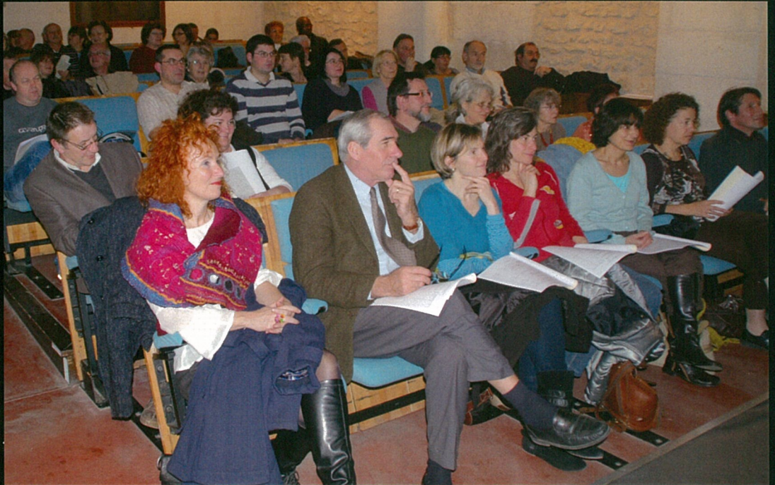
Public studieux pour l'A.G. de la MJC !