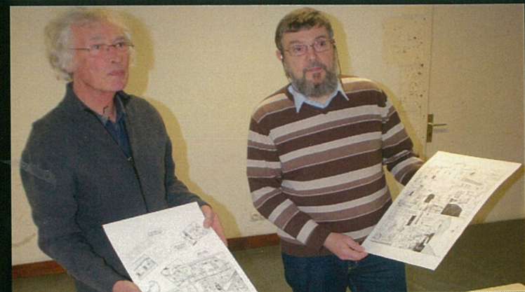
On pourrait faire entrer la BD "Le chineur" au musée. D'ailleurs ils l'ont fait