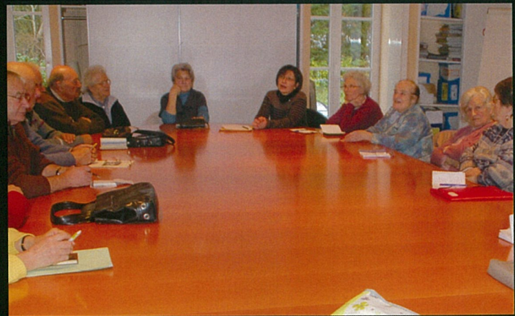
On pourrait en faire un monument, de l'A.G. de Boëme Patrimoine