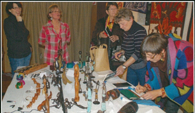
Kombavenir, les artisans de la solidarité !