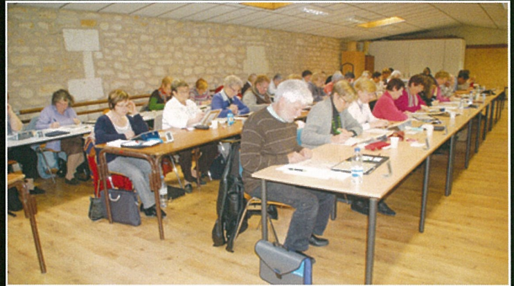
Maux (triple) de tête au scrabble..!

Sortira début mars. Les articles et annonces des associations et particuliers et le courrier des lecteurs devront être déposés à la mairie avant le 15 février Les activités prévues jusqu'à mi-avril pourront y être annoncées.