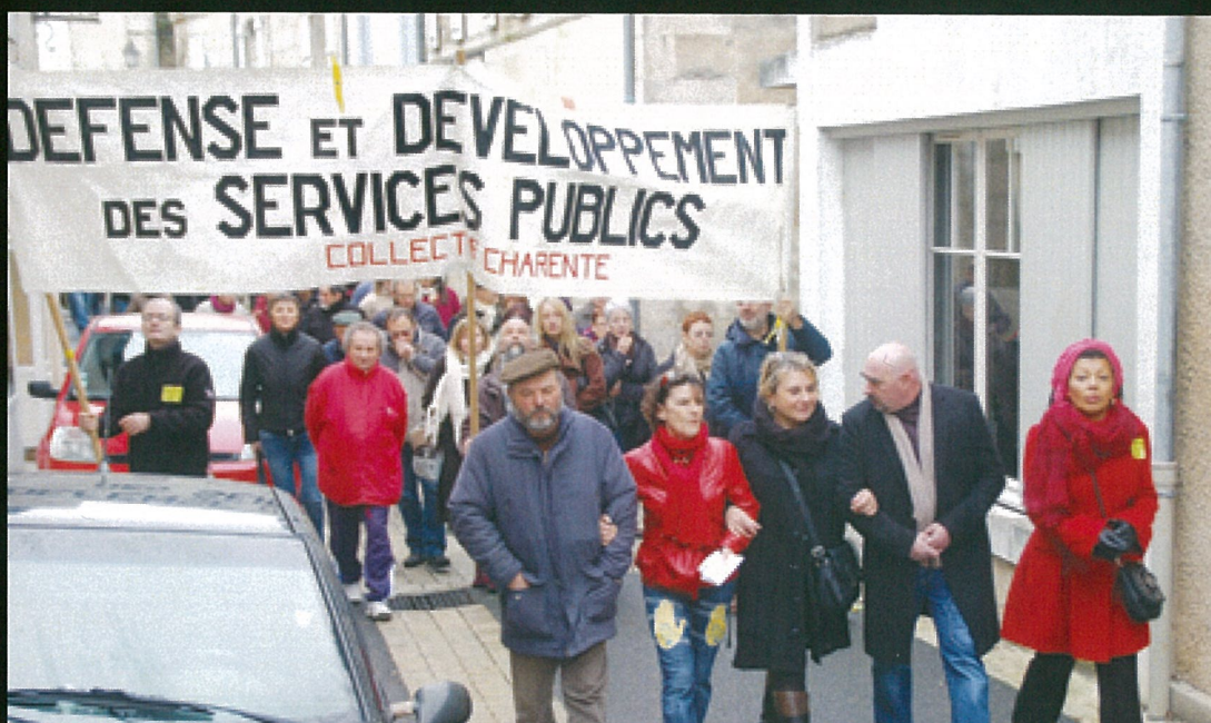
Lettres ou le néant : il faut défendre le service postal ! Photo