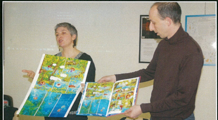
L'Histoire du VIème siècle avec une grande hache... et en BD !