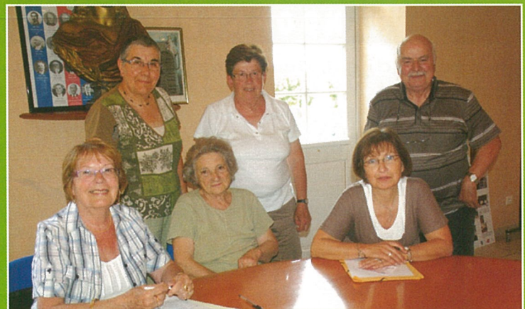
Boème Patrimoine a recueilli la mémoire du 24 août 1944