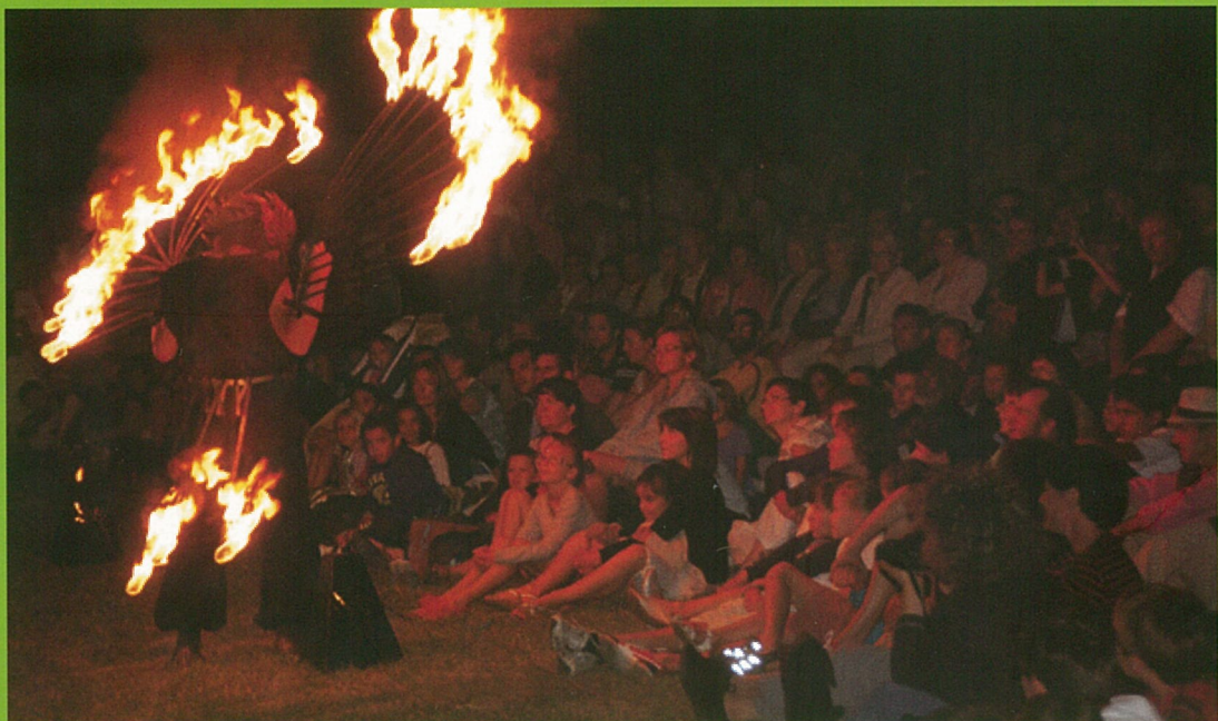
Un été show...