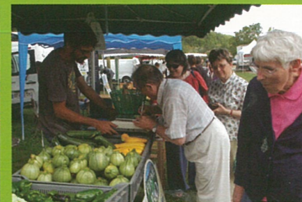
Marchés de Pays