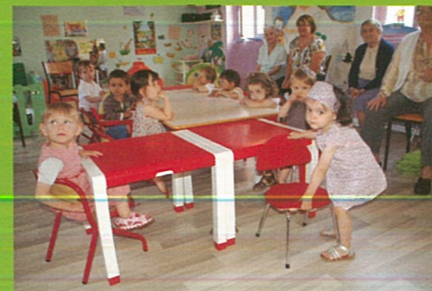
Rencontres entre générations