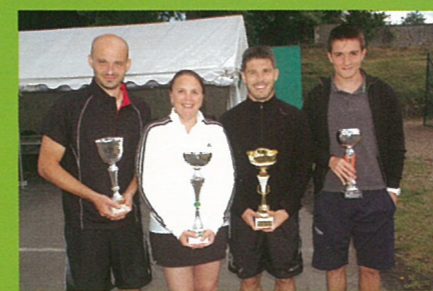
Faites du sport... ...fête de l'école