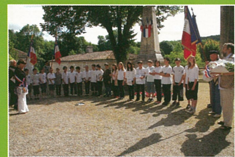
CÉRÉMONIE DU 18 JUIN

- Participation pour le financement de l'Assainissement Collectif Madame le Maire expose que la participation pour raccordement au réseau public d'assainissement collectif instituée par l'article L.1331-7 du code de la santé publique pour financer le service d'assainissement et perçue auprès des propriétaires d'immeubles achetés postérieurement à la mise en service du réseau public de collecte auquel ils sont raccordables, ne sera plus applicable pour les dossiers de permis de construire déposés à compter du 1er juillet 2012.