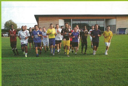
Foot, reprise d'août