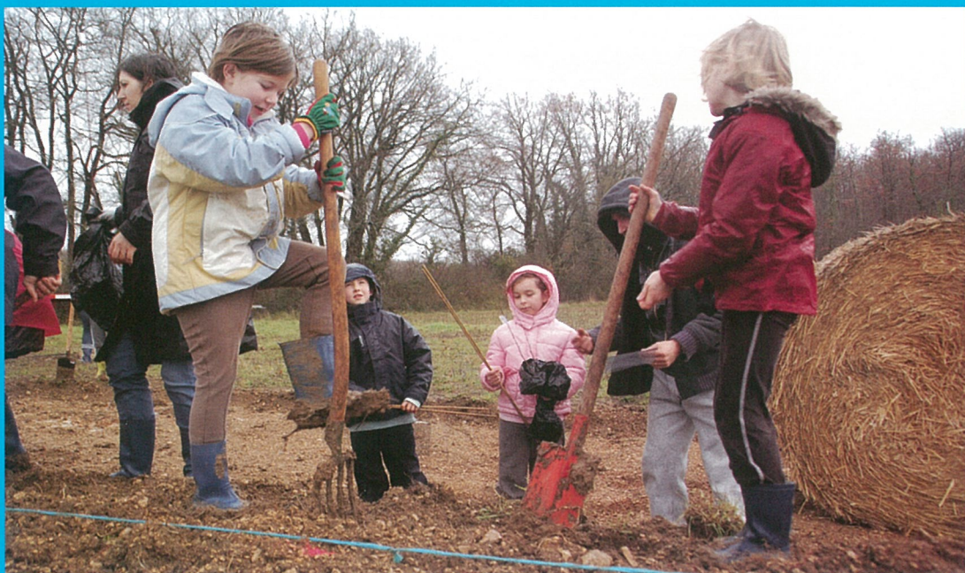
Deux jours en décembre, pour planter la haie, donneurs de plaisir et d'avenir !

Bulletin d'Information locale édité sous la responsabilité du Conseil Municipal de Mouthiers sur Boëme