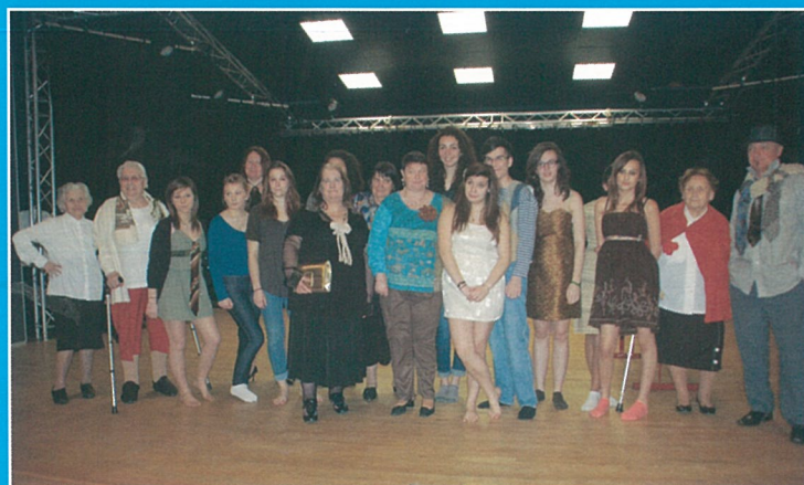
... et prépare son défilé de mai !