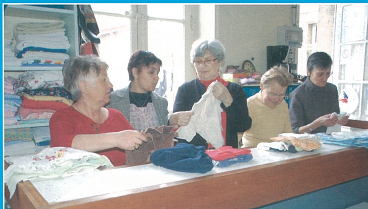
Le Secours Populaire met le bar très haut...