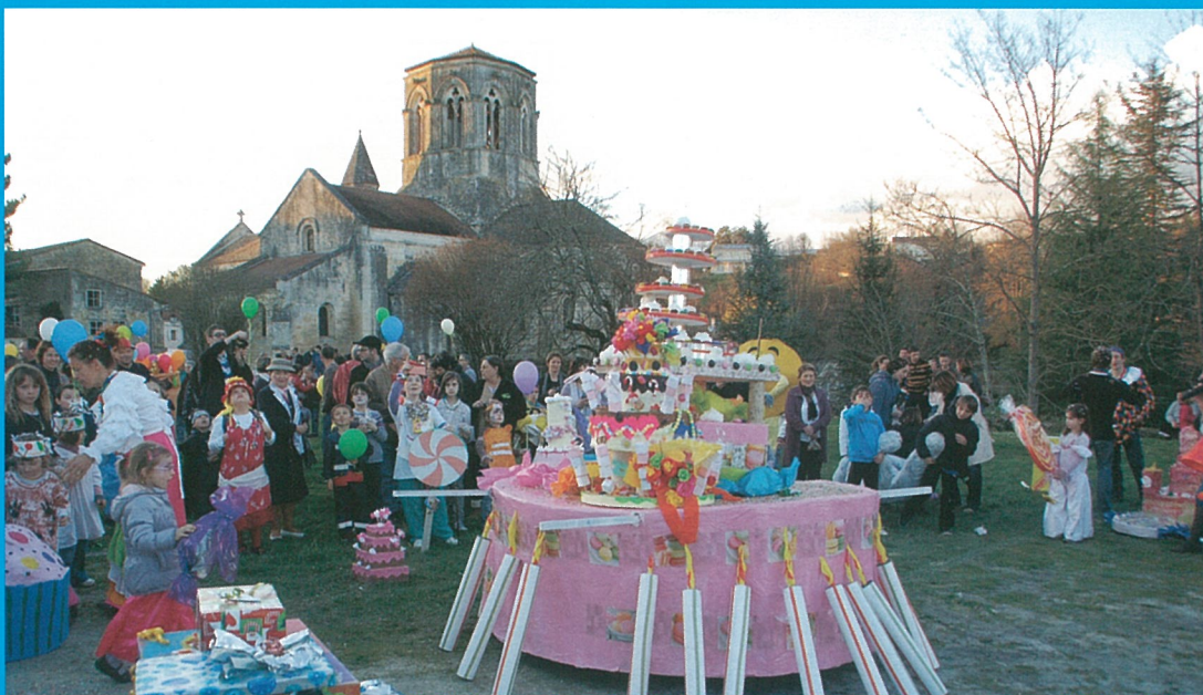
Carnaval 2013 était vraiment très... trentant !