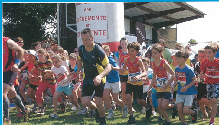
...les enfants aussi.