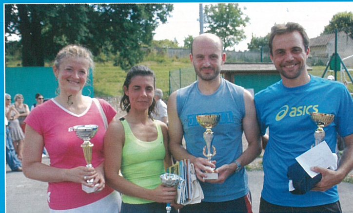
Les couleurs de la victoire !