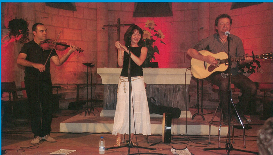
Le bel été : Nuits romanes, Mouthiers à Pas contés, Marchés de pays