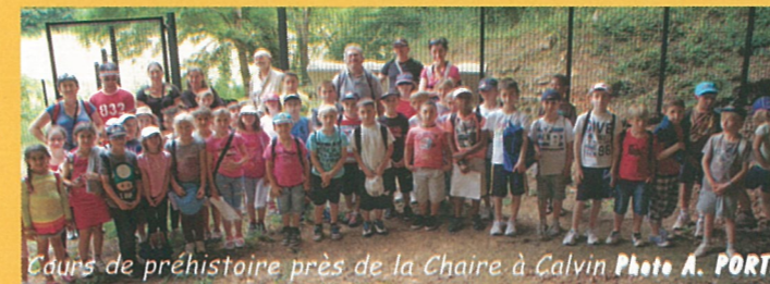
Cours de préhistoire près de la Chaire à Calvin