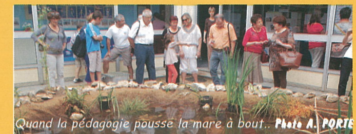
Quand la pédagogie pousse la mare à bout...