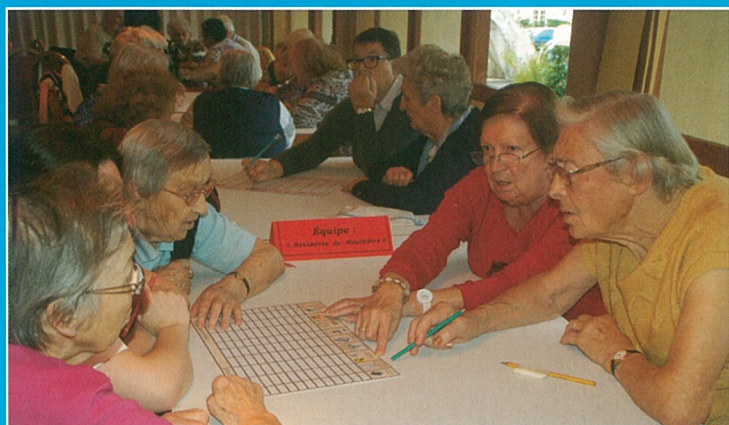
Petit bac à l'EHPAD

dimanche 8 : repas dansant du cercle des aînés salle Gilles Ploquin à 12 H