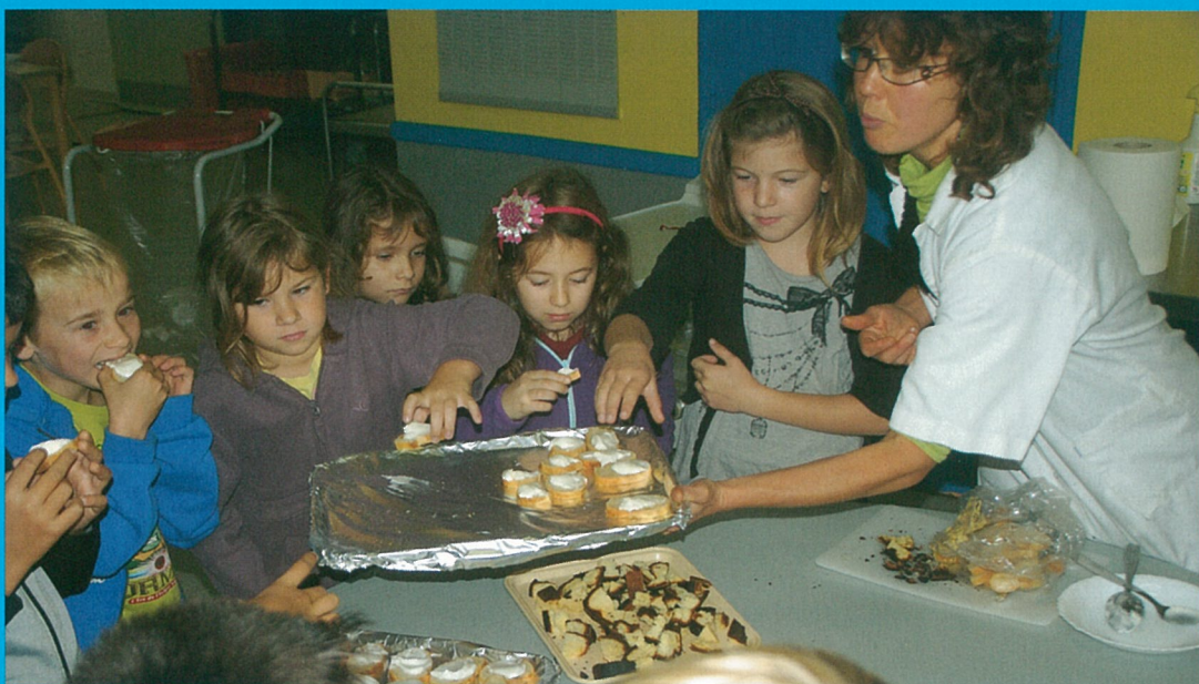
Semaine du goût à l'école

L'INFO du MOIS Mouthiers accueille ses amis de Petite Rosselle, notre commune jumelle.