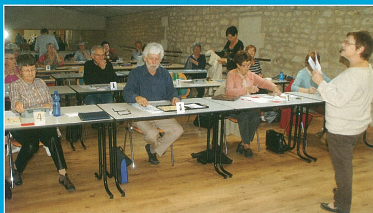
Scrabble départemental : l'esprit du jeu à la lettre !