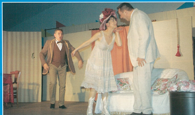
Le manteau d'Arlequin