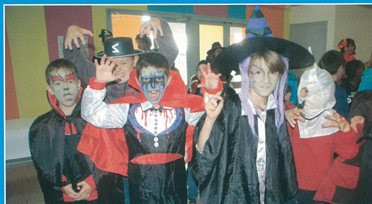
Soirée des fantômes !