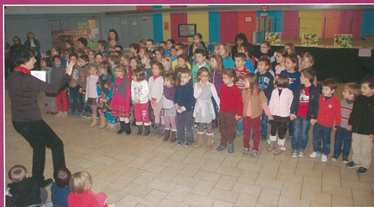
Les enfants ont chanté pour Lire en Fête.