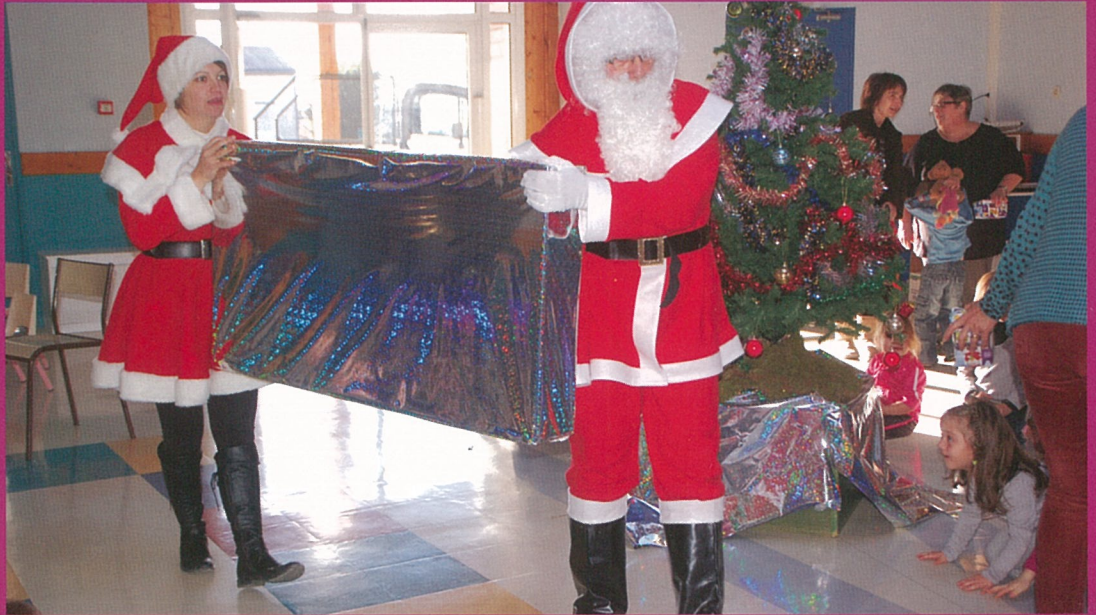
La paire Noël est passée..!