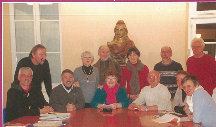
Déjà Mouthiers en fête 2014 se prépare.