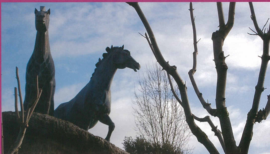
A cheval entre hiver et printemps...