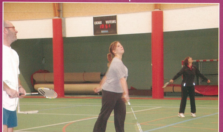
La forme et le punch pr le badminton