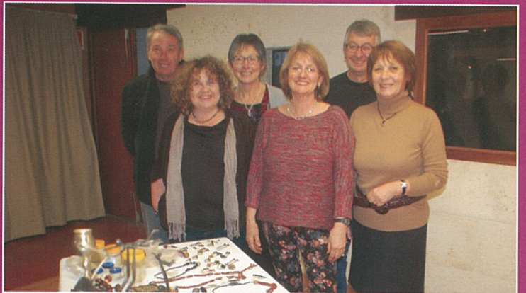
La solidarité internationale par Kombavenir