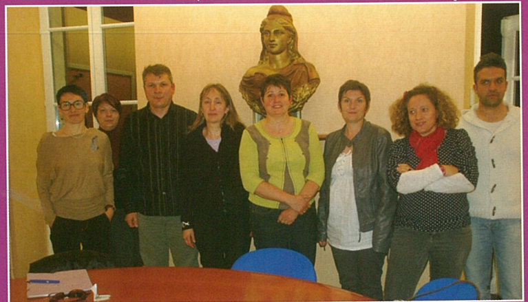
Le comité de fêtes en renaissance.