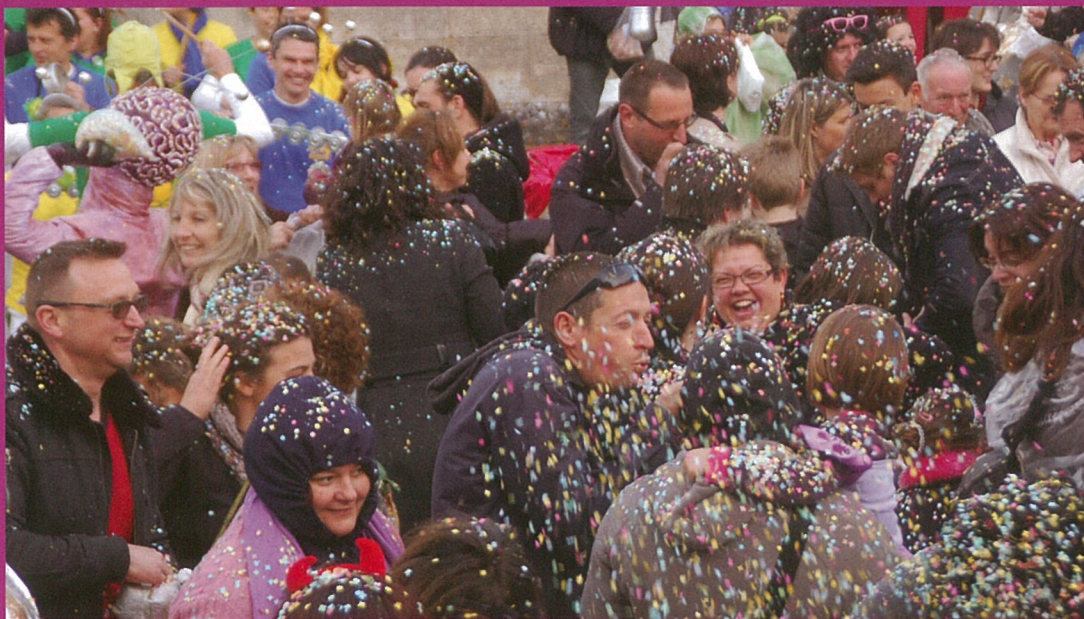
Giboulette de carnaval !