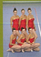
les gymnastes de plus de 11 ans à l'issue de la rencontre à Limoges le 23 mars.

l'équipe Excellence 3 qualifiée au championnat national