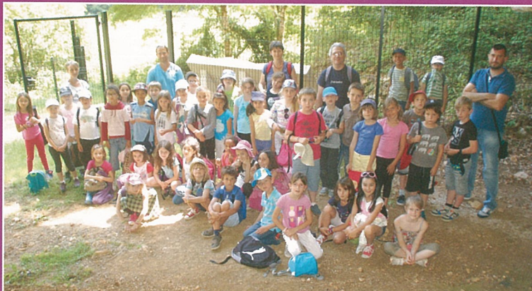
Les écoliers de Mouthiers font découvrir la chaire à Calvin à leur correspondants