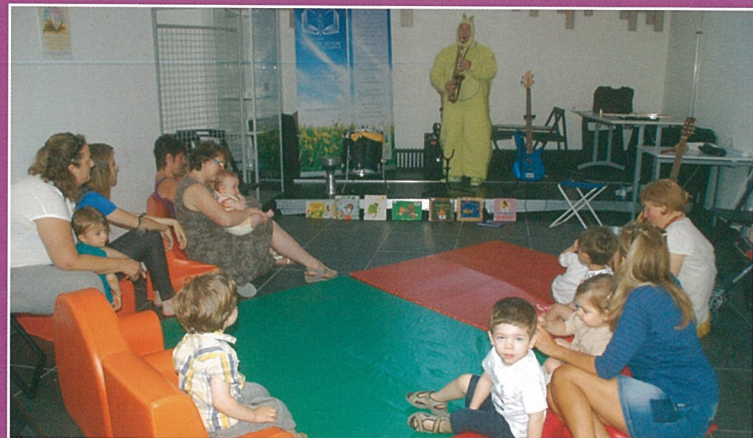
La médiathèque fait aussi crèche