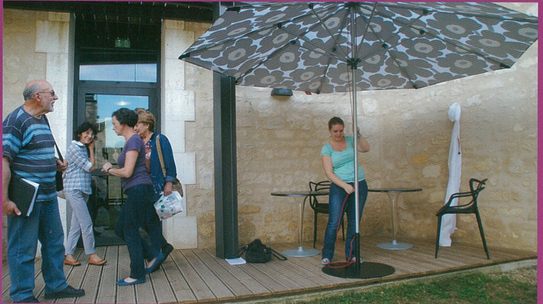
Un rayon de plus à la médiathèque : celui du soleil !