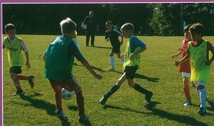
La mi-temps sera la bienvenue pour les jeunes pousses.