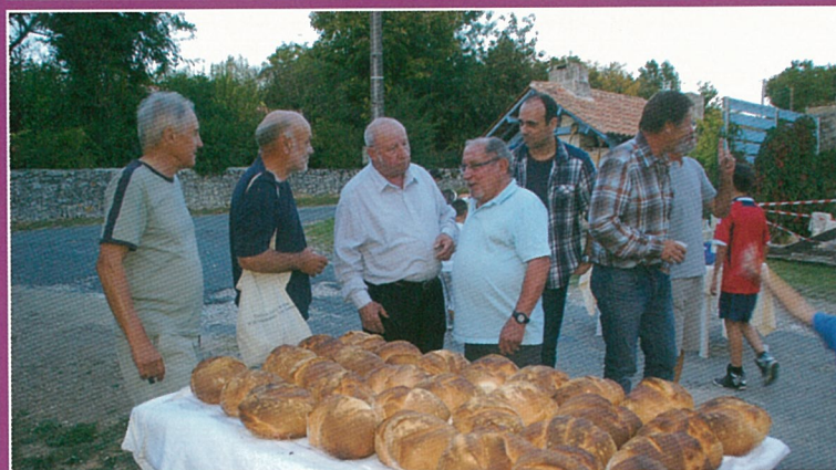
Plein d'amis et de la mie de pain au repas du quartier du rosier.

portera le n° 33 pour novembre. Les articles et annonces des associations et particuliers et le courrier des lecteurs devront être déposés à la mairie avant le 15 octobre. Les activités prévues jusqu'à mi décembre pourront y être annoncées.