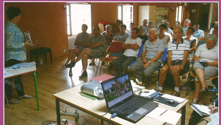
"Un chemin, une école " : les randonneurs marchent avec l'école