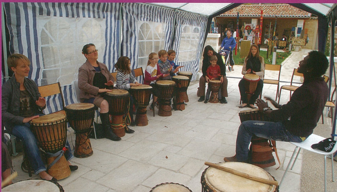
L'Afrique dans tous les sens à la médiathèque !