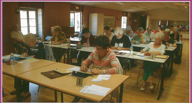
...dont c'était le championnat.