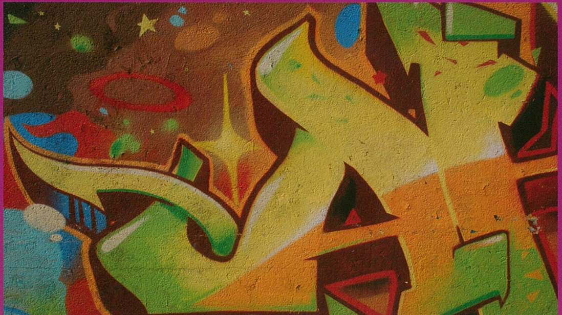
Est ce que c'est graph docteur ?