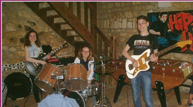
Junior associatio en concert