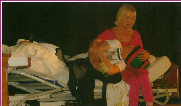
Oscar et la dame rose...