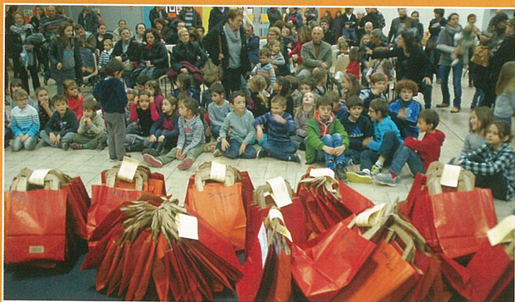
En fait, le plaisir de lire, les cadeaux en plus !