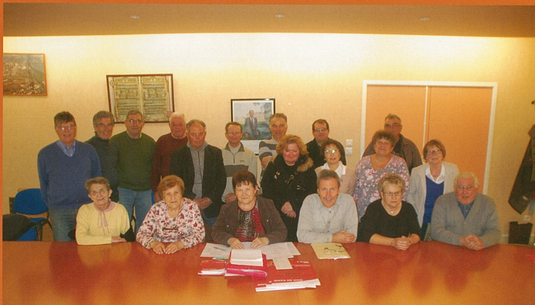
Les donneurs à sangs pour sangs au service des autres !