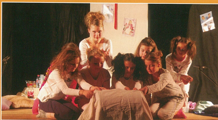
Spectaculaire et populaire : le secours !