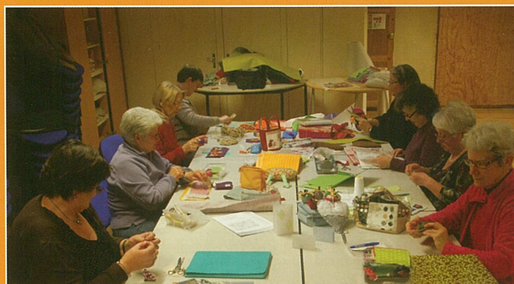
Atelier des transformatrices !