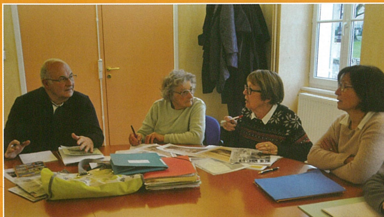
Boëme patrimoine prépare le futur en revisitant le passé.

7 : soirée Années 80 organisée par le Comité des Fêtes à 20 h 30 à la salle Gilles Ploquin