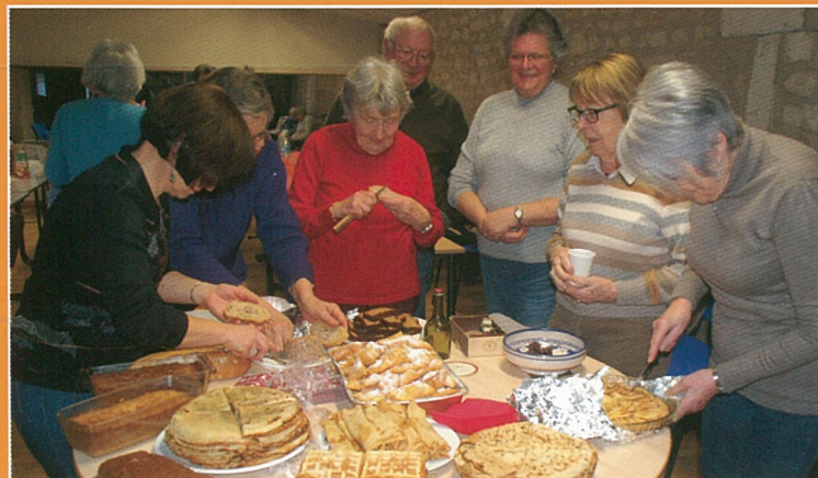
Eux et noix