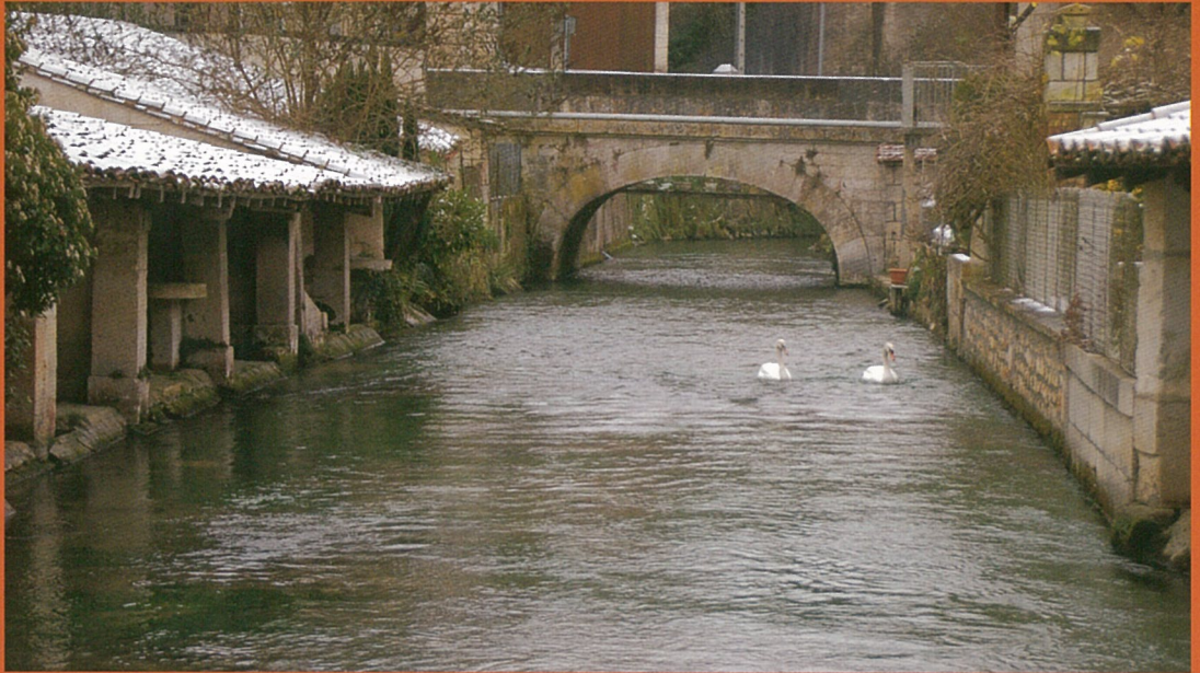
Pas d'ivresse des flocons quand viennent les cygnes du printemps...