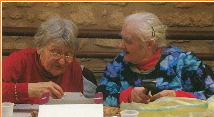
Casssser laaa noix.. !