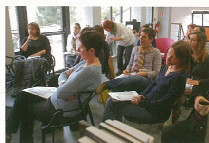
Rencontres de bibliothécaires