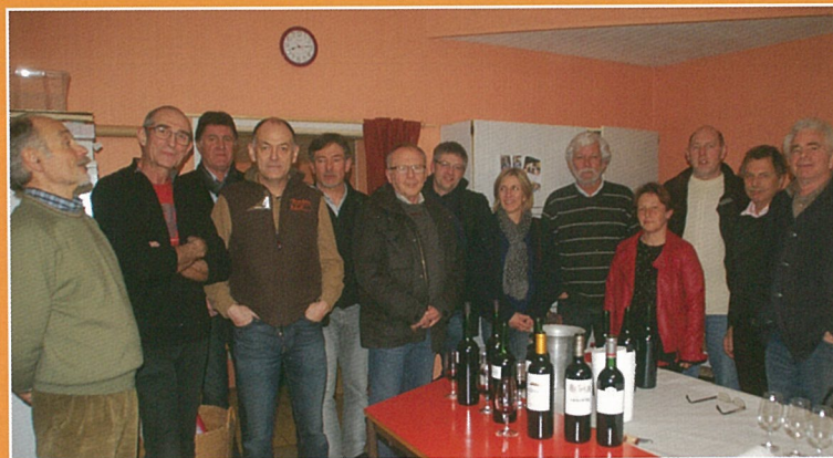
Le club oenologie prend de la bouteille.. !