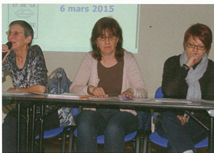
Le bureau de la M.J.C.

remettra le prix départemental du Ruban du patrimoine 2014 pour la création et la construction du bâtiment de la médiathèque de Mouthiers