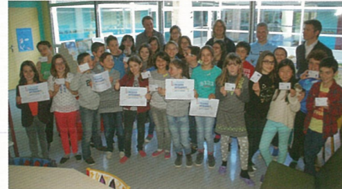
Permis internet pour les CM2