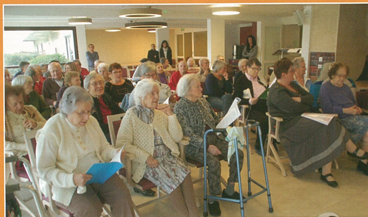
Les résidents de l'EHPAD au chant